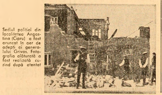
Sediul poliției din localitatea Angostina (Cipru) a fost aruncat în aer de oțelul Grivas. Fotografia alăturată a fost realizată curînd după atentat