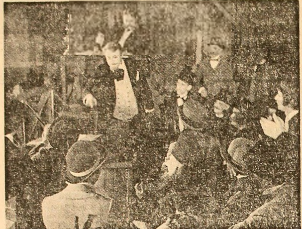
La scrisorile săptămânii, nemuritoare comedie a lui I. L. Corajide, „O SCRISOARE PIERDUTĂ”, în montajul lui Liviu Ciulei, se va prezenta, pe scena Teatrului „Lucia Sturdza Bulandra”, pentru a suta oară, în imagine, o scenă din spectacol