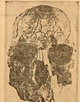
te descoperirile similare făcute pînă în prezent. Craniul din Kenya prezintă mari deosebiri față de „homo sapiens”, dar și față de toate celelalte forme cunoscute ale omului preistoric; de asemenea, nu poate fi integrat în nici una din actualele teorii despre evoluția omului. Potrivii aprecierilor oamenilor de știință, creierul adult din craniul descoperit în Kenya era de dimensiuni apreciabile, forma însăși a craniului amintind uimitor de cea a omului modern...

...aceasta este vîrstă craniului de om primitiv din imagine, descoperit în Kenya. El are cel puțin un milion de ani mai mult decît toa-