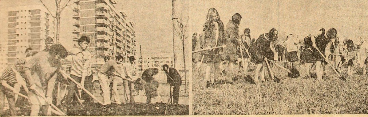
30.000 de tineri au participat ieri, în toate colțurile orașului, la ampla acțiune patriotică de înfrumusețare a Capitalei