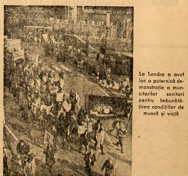
La Londra a avut loc o puternică demonstrație a muncitorilor sanitari pentru îmbunătățirea condițiilor de muncă și viață