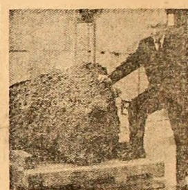
mească fiecare câte o „felie” de 400 kg. Restul se va întoarce în Australia. Se presupune că meteoritul este, de fapt, un fragment ce s-a desprins dintr-un meteorit mult mai mare, Mundrabilla (în greutate de 15 tone), care s-a prăbușit pe continentul de la antipodii și care se află, în prezent, expus în muzeul științific Perth.

Urișul meteorit metallic din fotografie, în greutate de 6,1 tone, a zăcut multă vreme nebagat în seamă pe o întindere pustie din Australia. Acum se găsește la Institutul de fizică nucleară „Max Planck” din Heidelberg (R.F.G.) unde va fi secționat în mai multe bucăți, urmînd ca Institutul Smithsonian din Washington, Academia de Științe din Moscova și British Museum din Londra să primească fiecare câte o „felie” de 400 kg. Restul se va întoarce în Australia. Se presupune că meteoritul este, de fapt, un fragment ce s-a desprins dintr-un meteorit mult mai mare, Mundrabilla (în greutate de 15 tone), care s-a prăbușit pe continentul de la antipodii și care se află, în prezent, expus în muzeul științific Perth.