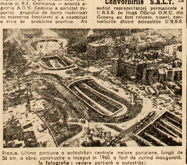
Fransa. Ultima porțiune a autostrăzii centrale înclinate porziene, lungă de 36 km, a cărei construcție a început în 1960, a fost de curînd inaugurată. În fotografie: vedere parțială a autostrăzii