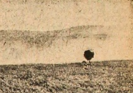
În unitățile agricole din județul Tulcea, însămințările de primăvară s-au încheiat timp. Acum, toate forțele sînt concentrate la întreținerea culturilor. La cooperativa agricolă din Caomurlia de Sus se execută lucrări de combatere a dăunătorilor.

Pînă la 13 mai, în județul Brăila s-au însămințat 92.000 hectare, din totalul de 114.000 hectare prevăzute a se cultiva cu porumb. Suprafața mare rămasă de semănat — în spe-