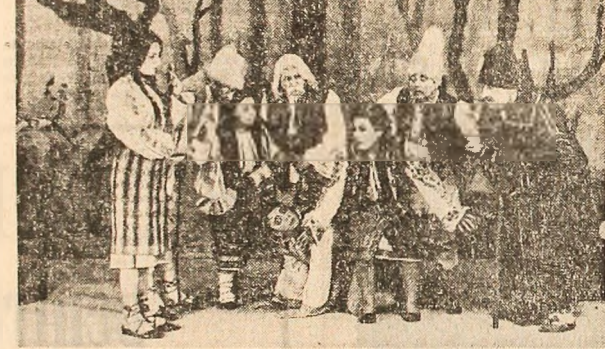
„Înșir-le mărgărite”, de Victor Eftimiu, la Teatrul „Victor Ion Popa” din Birlod

Pianistul Valentin Gheorghiu s-a întors recent dintr-un turcu în Suedia, unde a cîntat cu Filarmonica din Stockholm. Cronicarul ziarului „Svenska Dagbladet” suna despre pianistul român: „Valentin Gheorghiu este unul dintre puținii care au evoluat și s-au maturizat; pe parcursul carierei lor, numele său putînd fi promovat alături de cele ale lui Curzon, Serkin, Rubinstein și înră a lui Clivja. Interpretarea pe care a dat-o Concertului nr. 1 de Mendelssohn-Bartholdy se înscrisse printre evenimentele muzicale de nivel înalt, el stăpînîndu-se tehnica instrumentului său pînă la perfecțiune, făcînd sunetul să trăiască, să respire”.