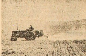
În unitățile agricole din județul Tulcea, însămințările de primăvară s-au încheiat timp. Acum, toate forțele sînt concentrate la întreținerea culturilor. La cooperativa agricolă din Caomurlia de Sus se execută lucrări de combatere a dăunătorilor.

În toate cooperativele agricole din județul Iași, care n-au încheiat încă semănatul porumbului, s-a lucrat duminică cu toate forțele la pregătirea terenului și la semănat. La Schitu Duca, de pildă, a intrat în câmp, la brigada Dumitreschi-Gălății, 8 tractoriști. Toți lucrău de zor, botărliți ca pînă seara să pregătească și să încheie semănatul pe ultima lară de 30 de hectare. La fel s-a lucrat duminică și la Dolhești, însămințîndu-se, pînă seara, ultimele 50 ha cu porumb. De asemenea, s-a lucrat cu opor, pînă seara tirziu, și la coopera-