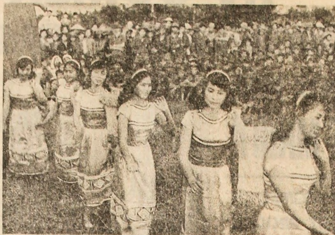
Pe pămîntul eliberat al Vietnamului de sud, un ansamblu de cîntece și dansuri, susținînd un program cultural pentru luptători din forțele patriotice

DILEMA OFIȚERULUI SAIGONEZ • ATELIERELE OBUZELOR NEEXPLODATE • INSCRIȚIE PE UN ECUSON : „NIMIC NU-I MAI DE PREȚ CA INDEPENDENȚA ȘI LIBERTATEA !”