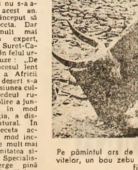
Pe pămîntul ars de secetă, presărat cu cadavrele vitelor, un bou zebu în căutarea zadarnică a unui fir de iarbă

de pe urma căreia a suferit, în primul rînd, șeptelul, principala sursă de ali-mentatie pentru populațiile din această regiune — scrie „Libre Belgique” un expert, geograful Jean Suret-Ca-nale, a explicat în felul ur-mător aceste cauze: „De șase decenii, procesul lent de transformare a Africii tropicale într-un deșert s-a accentuat. Expansiunea cul-turilor, prin procedul ru-dimentar de pirjolire a jung-lei, a degradat în mod progresiv vegetația, a dis-trus echilibrul natural. În aceste condiții, seceta ac-cidentă va avea în mod in-evitabil consecințe mult mai grave decît calamitatea si-milară din 1913”. Specialis-tul amintit merge pînă la capăt în dezvoltarea cauzelor reale, și anu-me, politica destructivă promovată de colonialism și neocolonialism pe con-tinentul negru — de men-țione a structurilor agrare arhaice, de substituie a culturilor alimentare cu culturi în scopuri specula-tive (bumbac, cafea, bana-ne), care a distrus echili-brul economic, dezinter-eșul față de modernizarea a-gricului, față de promo-varea lucrărilor de hidro-amelorații și irigații. Acești factori sînt, în ultimă instanță, principalii vino-vați de dezastru care amenință viața a milioane de oameni.