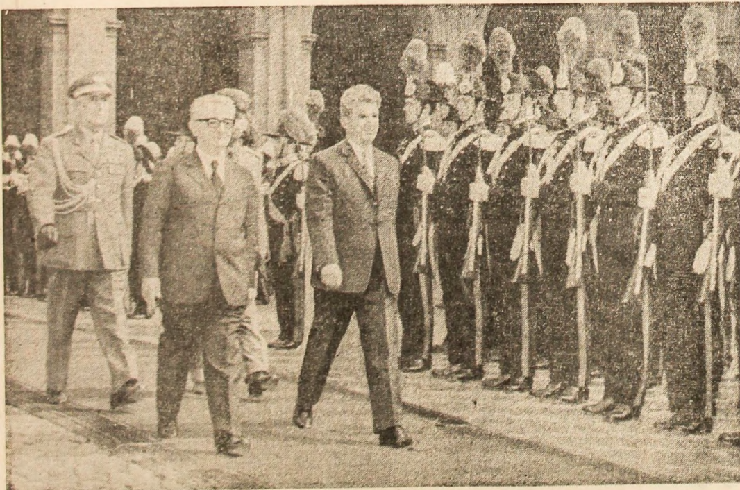
Se trece în revistă garda de onoare

Tovarășei Elena Ceaușescu i s-a înminat ordinul „Marea Cruce a Meritului Republicii”. Schimbul de decorații ilustrează bunele relații, în continuă dezvoltare, dintre cele două țări și popoare.