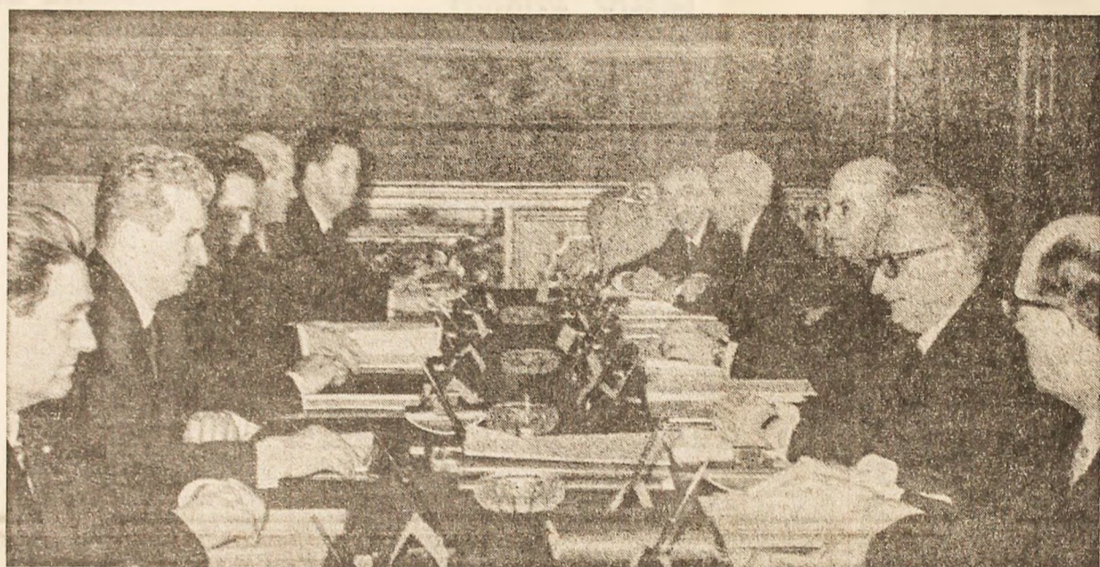
În timpul convorbirilor oficiale între președinții Nicolae Ceaușescu și Giovanni Leone

„DOCUMENTELE PE CARE LE-AM SEMNAT ASTĂZI DAU EXPRESIE ATÎT RELĂȚIILOR, CIT ȘI REALIȚĂȚII ACTUALE ÎN RAPORTURILE DINTRE ROMÂNIA ȘI ITALIA, EXPRIMA DORINȚA CELOR DOUA GUVERNE, A CELOR DOUA POPOARE DE A ACȚIONA ȘI ÎN VIITOR PENTRU EXTINDEREA COLABORĂRII ȘI COOPERĂRII LOR MULTILATERALE. DAR, ÎN ACELAȘI TIMP, ELE AU ȘI O ÎNSEMNĂTATE MAI LARGĂ, INTERNAȚIONALĂ, PENTRU CĂ ÎNSCRIU PRINCIPII ȘI ANGAJAMENTELE POPOARELOR ȘI GUVERNELOR NOASTRE DE A FACE TOTUL PENTRU O COLABORARE LARGĂ ÎNTORE TOATE NAȚIUNILE LUMII, PENTRU O LUME MAI DREAPTĂ, MAI BUNĂ”. NICOLAE CEAUȘESCU — la semnarea Declarației solemne