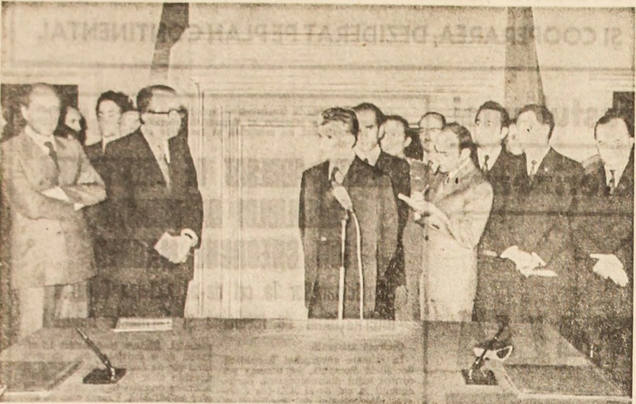
(Carmare din pag. 1) Iul de Stat al Republicii Socialiste România au rostit aceluși cuvânt. În cuvântul său, primul ministru, Giulio Andreotti, a spus:

Domnule președinte, Permiteți-mi să exprim satisfacția guvernului nostru pentru semnarea Declarației solemne, a Acordului de cooperare dintre Italia și România, pentru celelalte documente care au fost semnate sau care vor fi semnate în curând.