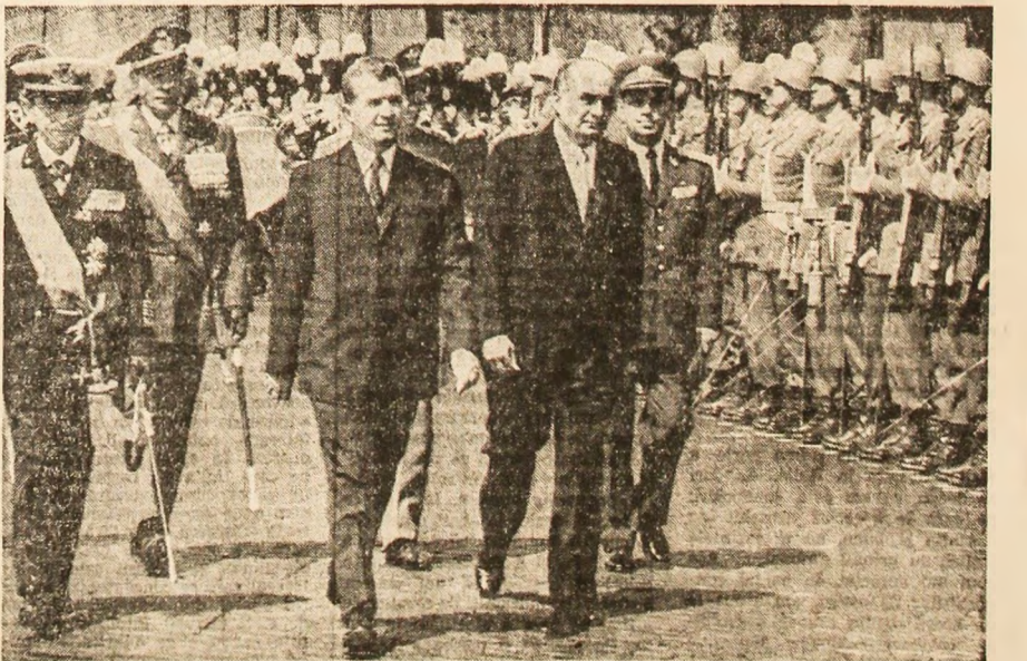
În timpul ceremoniei de la Altarul patriei, tovarășul Nicolae Ceaușescu trece în revistă garda de onoare

După primul război mondial, la nivelul întîii al clădirii, a fost creat „Altarul patriei”, avînd în centru statuia Romei, înconjurată de un grup sculptural alegoric care sugerează „dragostea de patrie” și „gloria muncii”, simbolice denumiri ilustrînd de fapt înseși ele-