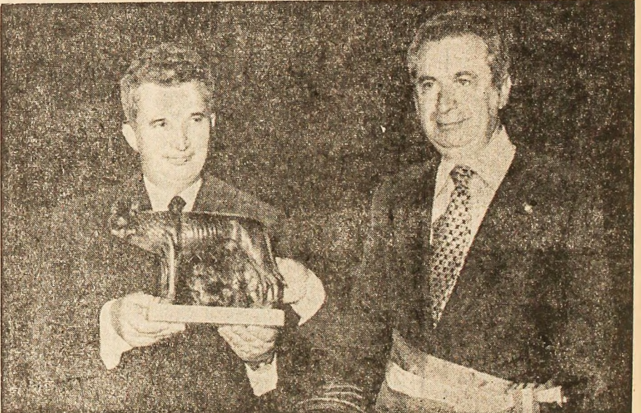
Primarul Romei oferă tovarășului Nicolae Ceaușescu „Lupoica Capitolină” — simbol al Cetății Eterne