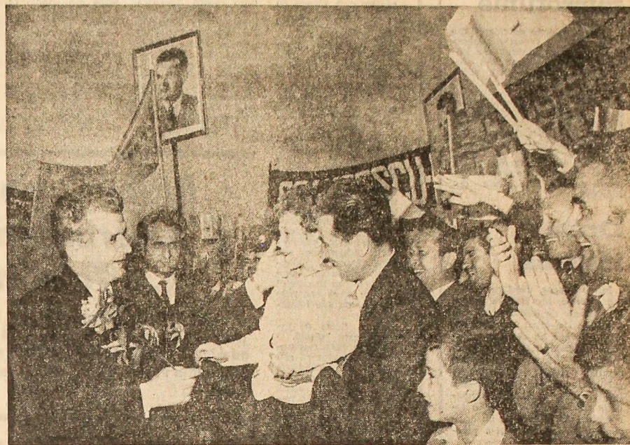
La întoarcerea în patrie, bucurăsenii salută cu entuziasm pe conducătorul iubit

Ieri, pe aeroportul Otopeni, a fost întâmpinat de mii și mii de locuitori ai Capitalei, de conducerea de partid și de stat. Un călduros și entuziast bun sosit, aprobare deplină activității prestigioase desfășurate în interesul patriei noastre, al păcii și cooperării în lume.