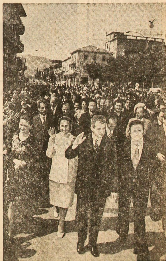
Căldă manifestare de bun rămas la plecarea din San Marino

Aeronava prezidențială decolează cu destinația Roma.