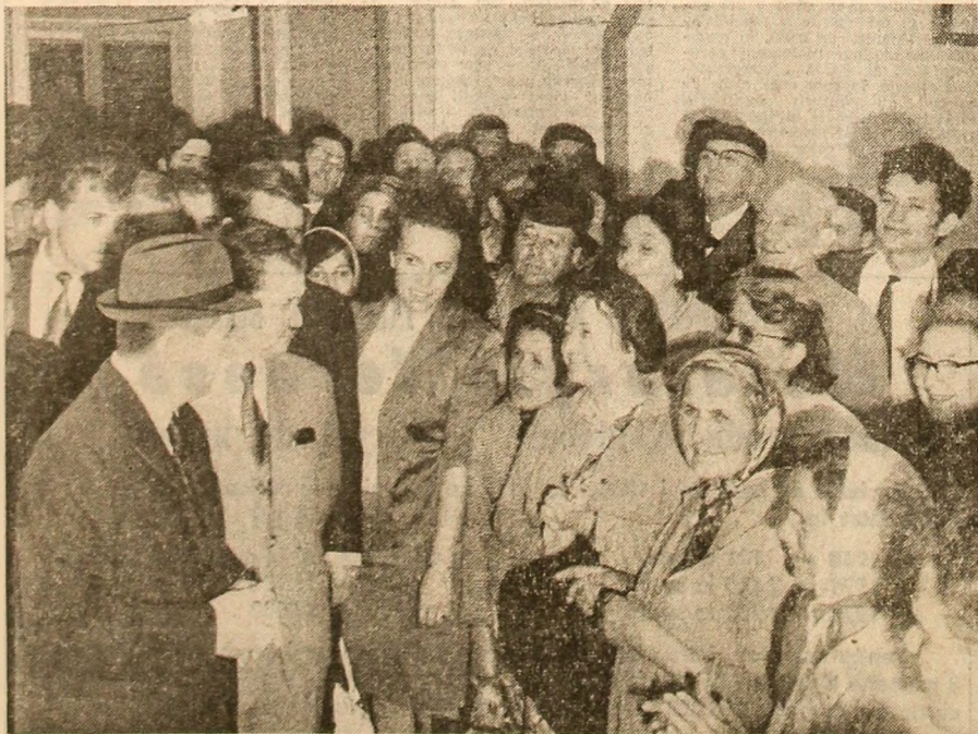
Piața „7 Noiembrie”: primire călduroasă, dialog fructuos