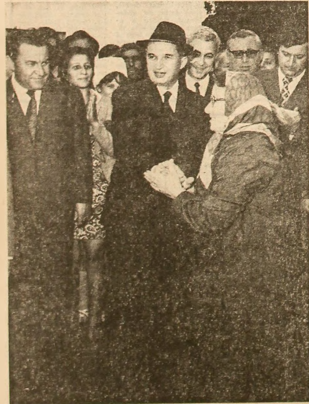
Trei momente din timpul vizitei de ieri în piețe, nou prilej de discuții cu cetățenii și edilii Capitalei privind perfecționarea activității comerciale și aprovizionarea tot mai bună a populației

brica de beton celular autoclavizat, analiză la fața locului a funcționalității construcțiilor industriale și de locuințe, după tehnologii moderne