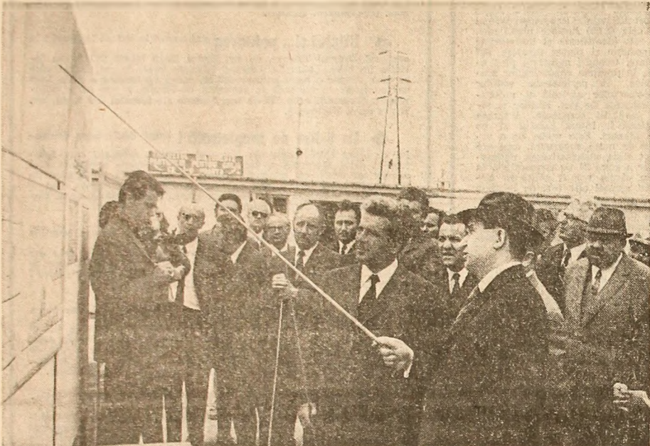
La Uzina de utilaj chimic se analizează rezultatele aplicării cu succes în viață a recomandărilor făcute de secretarul general al partidului din primăvara anului trecut, se stabilesc noi repere ale dezvoltării producției

• O atentă trecere în revistă a progreselor realizate în organizarea comerțului și aprovizionării populației • Constatări pozitive, dar și observații și recomandări, însoțite de cerința unei transpuneri operative în practică • Manifestări de stimă și cald atașament față de secretarul general al partidului