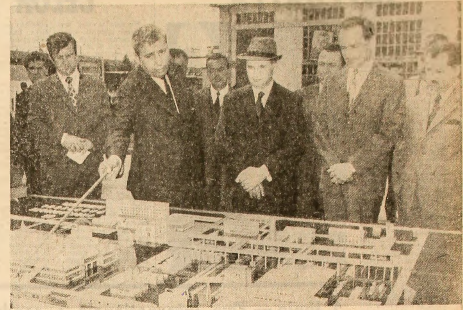
La întreprinderea de prefabricate „Progresul”...

...și la fabrica de beton celular autoclavizat, analiză la fața locului a funcționalității construcțiilor industriale și de locuințe, după tehnologii moderne