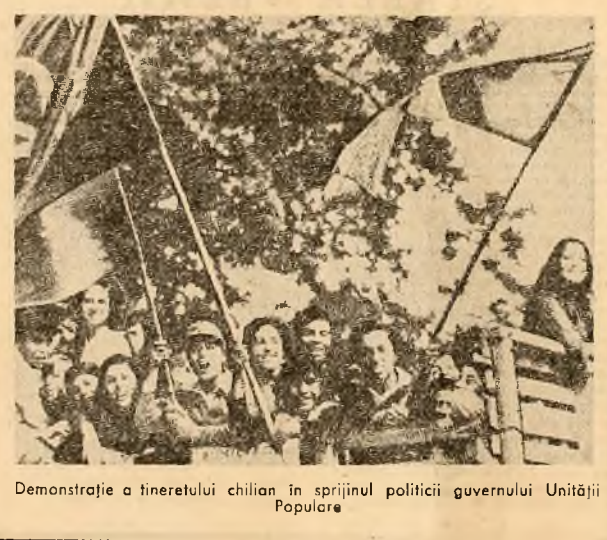
Demonstrație a tineretului chilian în sprijinul poliției guvernului Unității Populare

Redeschiderea bursei occidentale a confirmat persistența incertitudinii pe piețele monetare și la începutul acestei săptămâni. Cursul dolarului S.U.A. a scăzut puternic, luni, la Londra, Paris și Frankfurt pe Main, în raport cu moneda vestgermană. Lira sterlină și francul francez, și a pierdut sensibilitate în fața volatilității monedei occidentale, cu excepția yenului japonez și a lirei italiene. La Frankfurt pe Main, dolarul a atins cel mai redus nivel în raport cu moneda vest-germană, respectiv 2.5550 marci, față de 2.5825 cit fusese cotațat vineri la închiderea bursei. De asemenea, la Londra, lira sterlină și-a revenit, recitând în marje pozitive pierdute în ultimele 12 luni, fiind cotată la 2.5854 dolari față de 2.5795, cit înregistrase vineri. Această situație s-a semnalat și la Paris, unde dolarul a scăzut la 4.2275 față de 4.2728 la închiderea bursei, vineri. În același timp, prețul aurului a crescut din nou cu aproximativ doi dolari față de nivelul atins vineri la închiderea bursei, stătuindu-se la Londra la 123,50 dolari uncia, la Zürich la 121-123 dolari uncia, la Paris la 121,50 dolari uncia, iar la