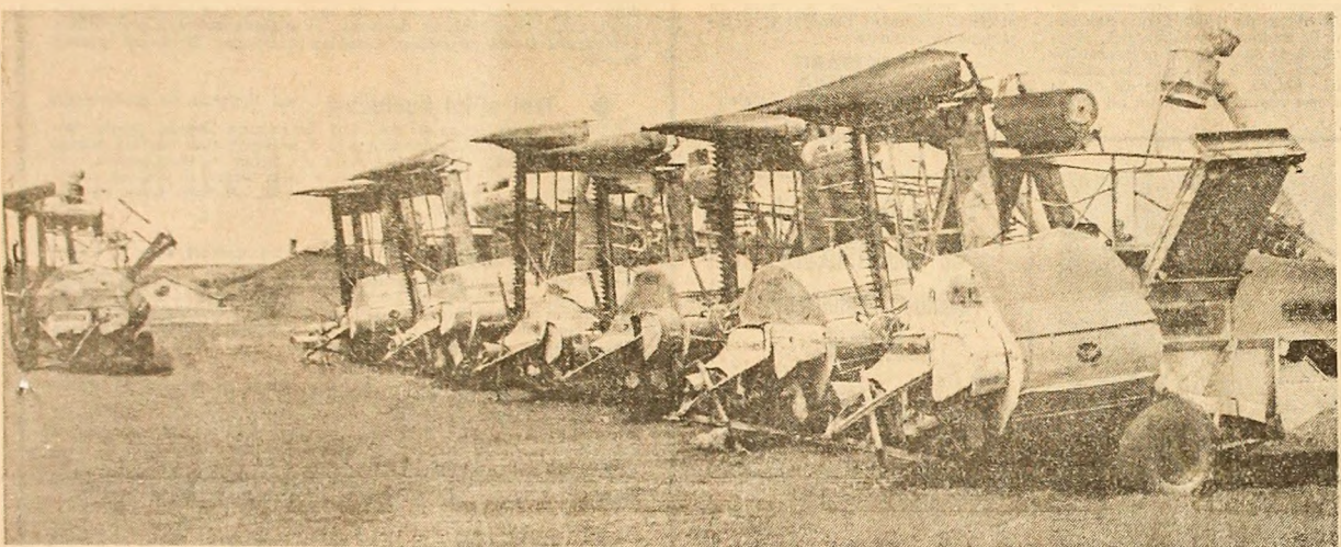
Combine gata pentru a intra în lan. Imagine surprinsă la S.M.A. Târlățești, județul Ilfov

La lucrările plenarei, ce se vor desfășura timp de două zile, participă ca invitați primii secretari ai comitetelor județene, membri ai guvernului, conducători ai organizațiilor de masă și obștești, redactori-șefi ai presei centrale — care nu sînt membri ai Comitetului Central.