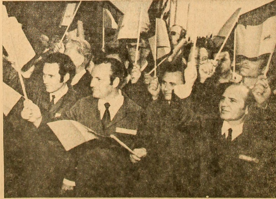
Călduroasă manifestare de simpatie.

halele de producție, oaspetilor le sînt prezentate piese de înaltă tehnicitate produse aici.