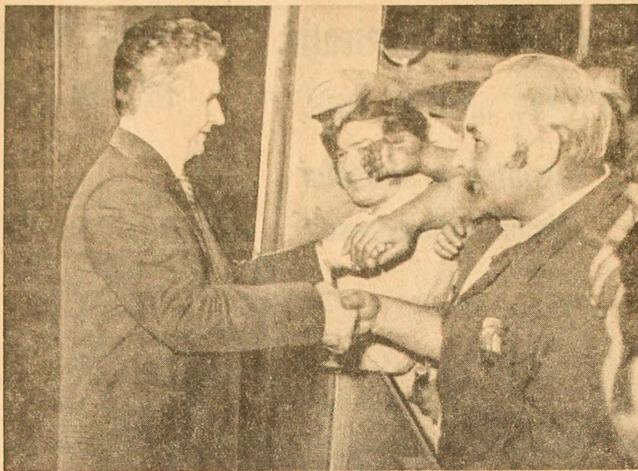
Gesturi semnificative de stimă și admirație