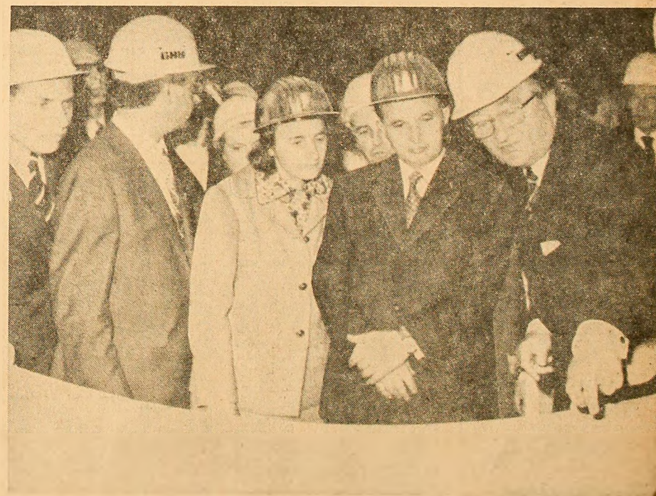
În timpul vizitei la uzina constructoare de mașini grele G.H.H.-Sterkrade

pentru colaborare și pace în lume! (Aplauze).