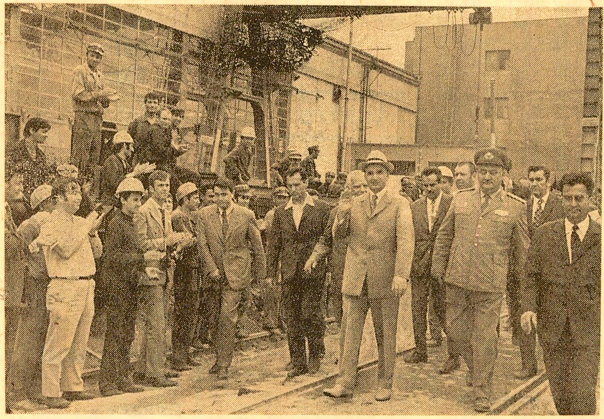
Conducătorul partidului și statului este salutat cu căldură și entuziasm