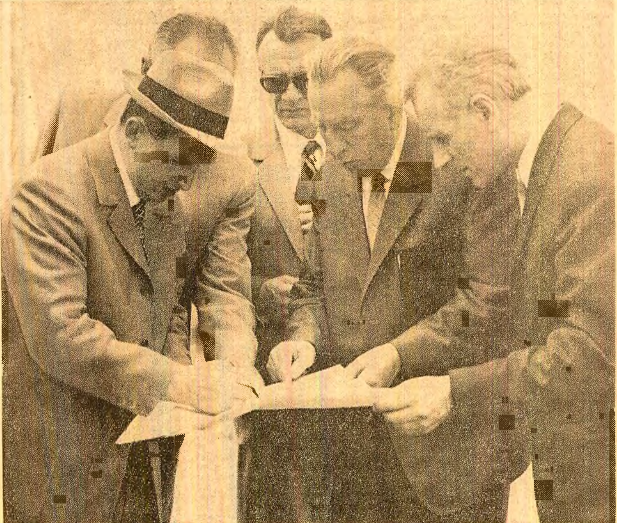
Fructuos dialog cu specialiștii