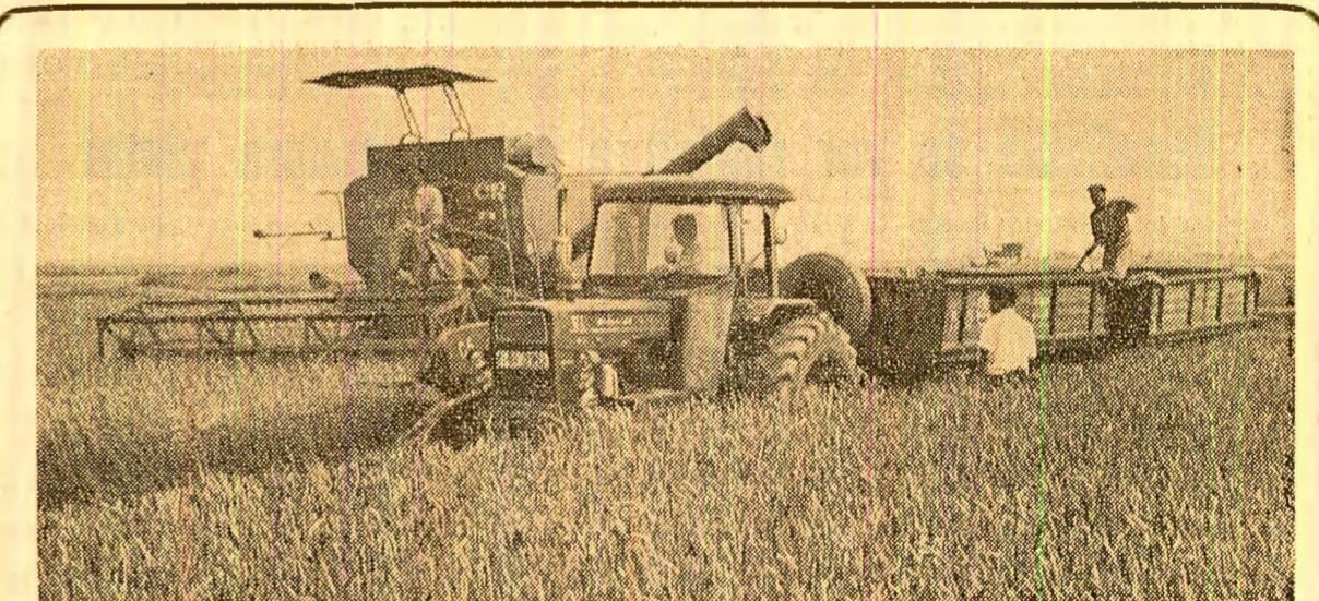
Imagine frecventă pe ogoare. La cooperativa agricolă lanca, județul Brăila, se lucrează la recoltat din zori pînă în noapte

Jean Bedel Bokassa, cu soția, doamna Catherine Bokassa, vor efectua o vizită neoficială în țara noastră, în a doua parte a lunii Iulie a.c.