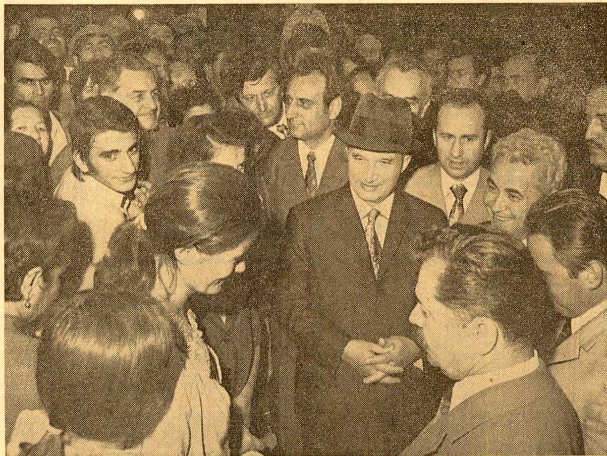
Secretarul general al partidului a întâlnit pretutindeni în vizita de ieri, surisul și caldă primire ale cetățenilor Capitalei

Interesindu-se de bunul mers al producției alimentare, comertului și aprovizionării populației