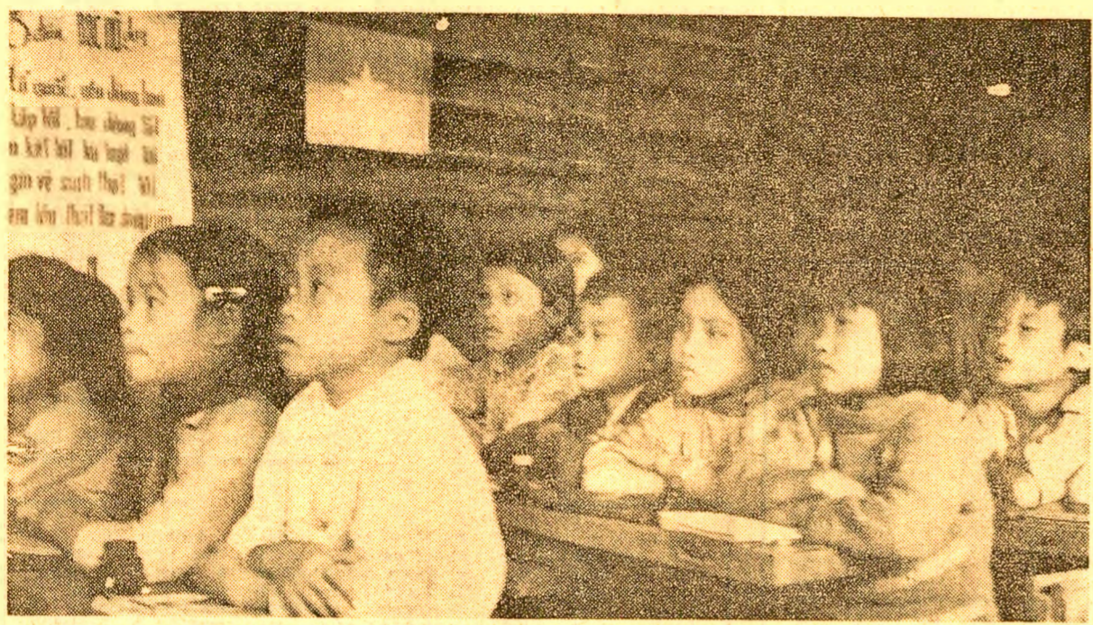
În regiunile aflate sub controlul G.R.P. al Republicii Vietnamului de Sud, viața se normalizează treptat. În fotografie: aspect dintr-o școală primară din districtul Gio Linh, provincia Quang Tri