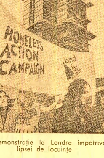
Demonstrație la Londra împotriva lipsei de locuințe

Lansarea stației interplanetare sovietice „Mars-4”