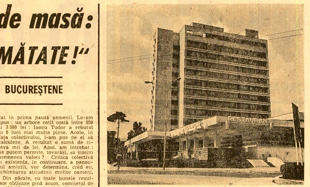
Un hotel nou în Ploiești nu putea să fie bolezat altfel decît... „Prahova”