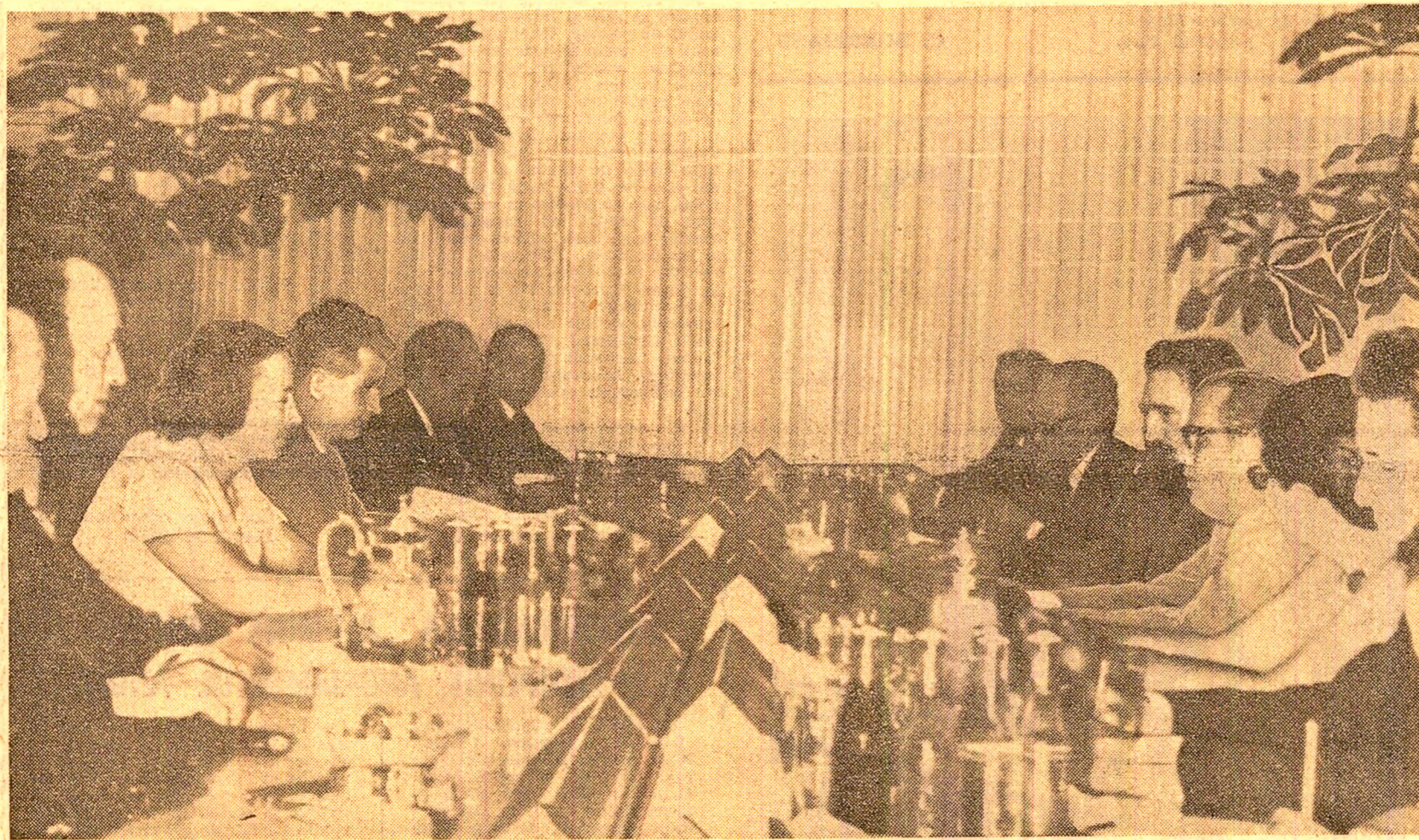
În timpul convorbirilor oficiale