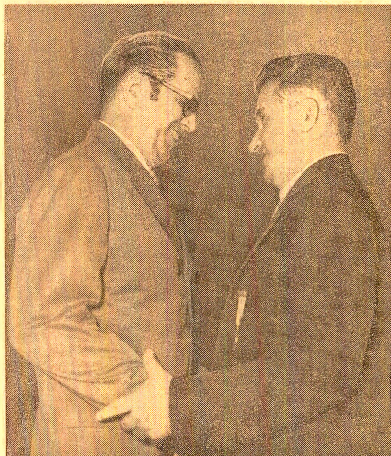
La ceremonia decorării tovarășului Nicolae Ceaușescu cu Ordinul „José Martí”

În încheierea ceremoniei, tovarășul Nicolae Ceaușescu și tovarășii Elena Ceaușescu și-a fotografiat cu tovarășii Fidel Castro Ruz și Osvaldo Dorticos Torrado.