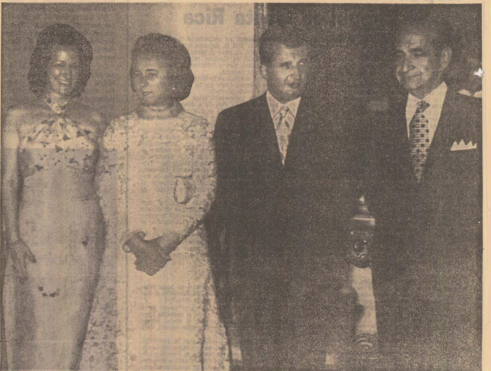
Luni seara, în saloanele impunătorului edificiu „Casa Amatilla” (Casa galbenă), care adăpostește Cancelaria prezidențială și alte importante instituții guvernamentale, președintele Republicii Costa Rica, José Figueres Ferrer, a oferit o recepție în onoarea președintelui Consiliului de Stat al Republicii Socialiste România, Nicolae Ceaușescu, și a tovarășei Elena Ceaușescu.