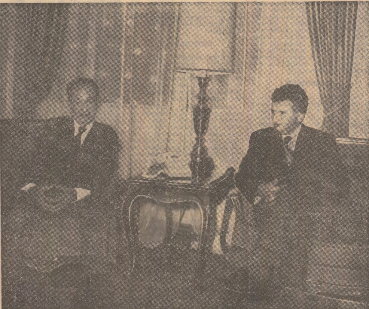
In timpul convorbirilor oficiale

Cu acest prilej, președintele Nicolae Ceaușescu a adresat șefului statului costarican invitația de a face o vizită în România. Invitația a fost acceptată cu plăcere.