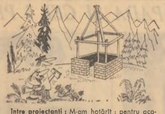
Între proiectanți: M-am hotărît: pentru cooperis, aducem stuf din Delta!!!