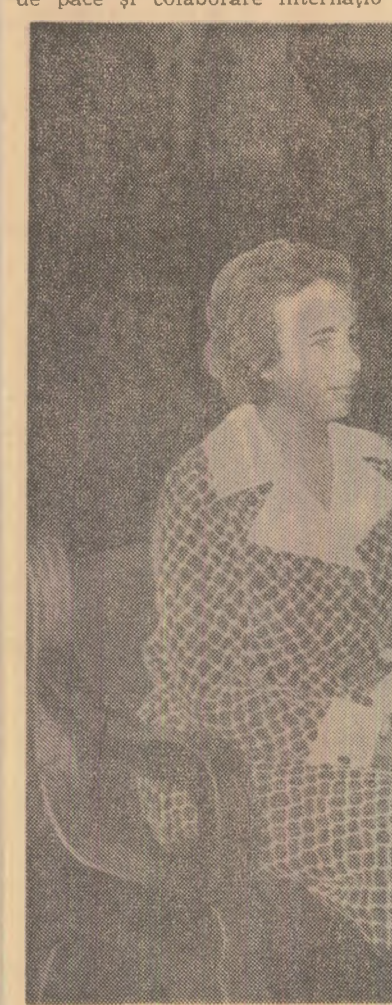
Moment din timpul întîlnirii dintre tovarășa Elena Ceaușescu și Karen Olse de Figueres

gerii și a schimburilor pozitive, menținerea și întărirea păcii. Într-una din lucrările dumneavoastră, intitulată „Pentru o politică de pace și colaborare internațio-