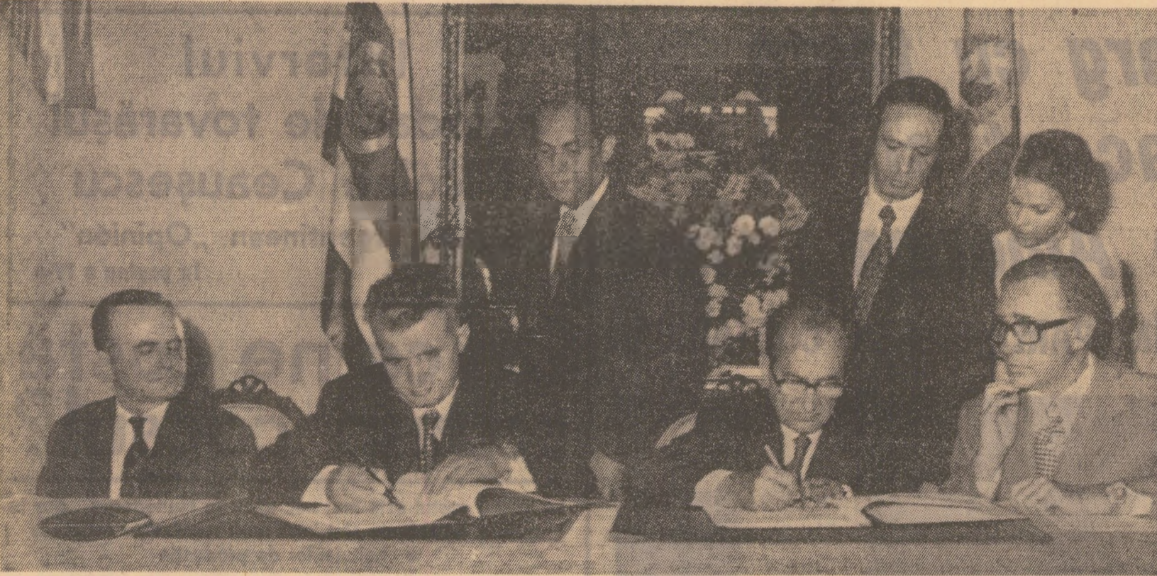
Marți dimineață, după încheierea convorbirilor oficiale, a avut loc ceremonia semnării Tratatului

Doresc succes acțiunilor de colaborare dintre popoarele noastre, pentru o pace trănică. (Aplauze).