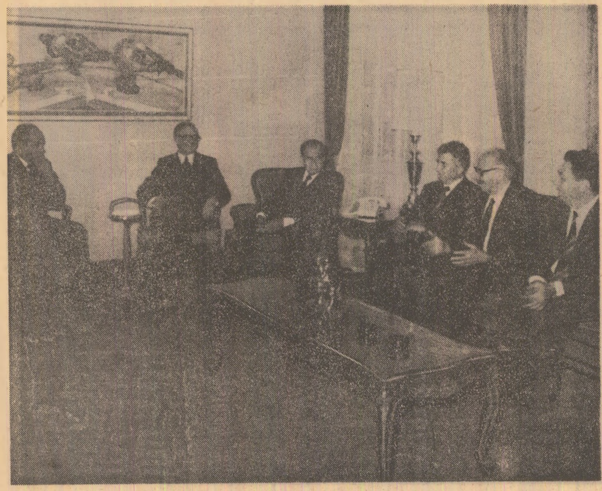
Un dialog constructiv — rezultate rodnice

celelalte două de George Macoveșcu, ministrul afacerilor externe. Din partea costaricană, cele trei acorduri au fost semnate de Gonzalo Facio, ministrul afacerilor externe. S-a convenit, totodată, efectuarea unui schimb de note privind încheierea unei înțelgeri referitoare la facilitarea acordării vizelor.