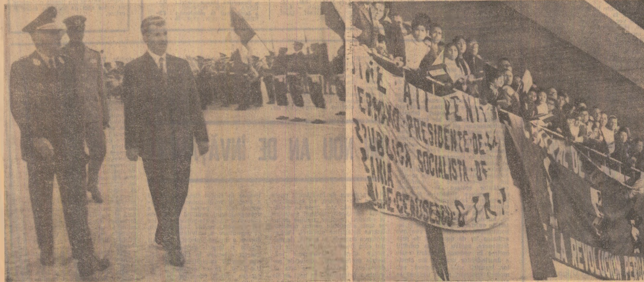
Călduroasă primire rezervă înalților oaspeți români în capitala Perului