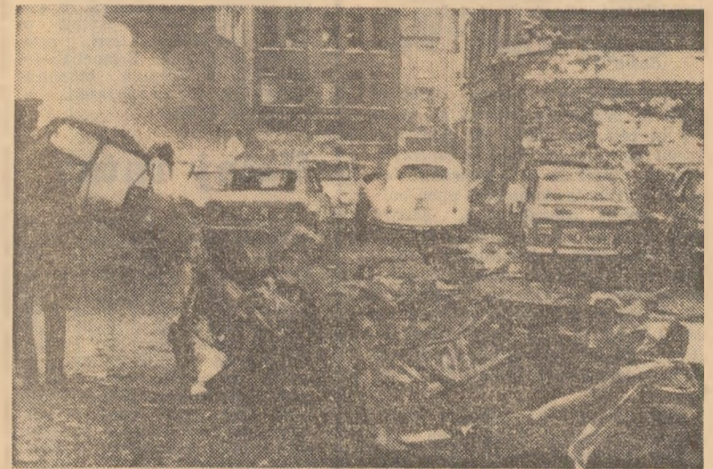
Irlanda de Nord. La Belfast s-au înregistrat noi atentate cu bombe. Fotografia de mai sus a fost realizată la scurt timp după una din recentele explozii

Participanții au căzut de acord, de asemenea, asupra adoptării în comun de programe de luptă împotriva poluării și, în special, de combatere a deversărilor de substanțe toxice.