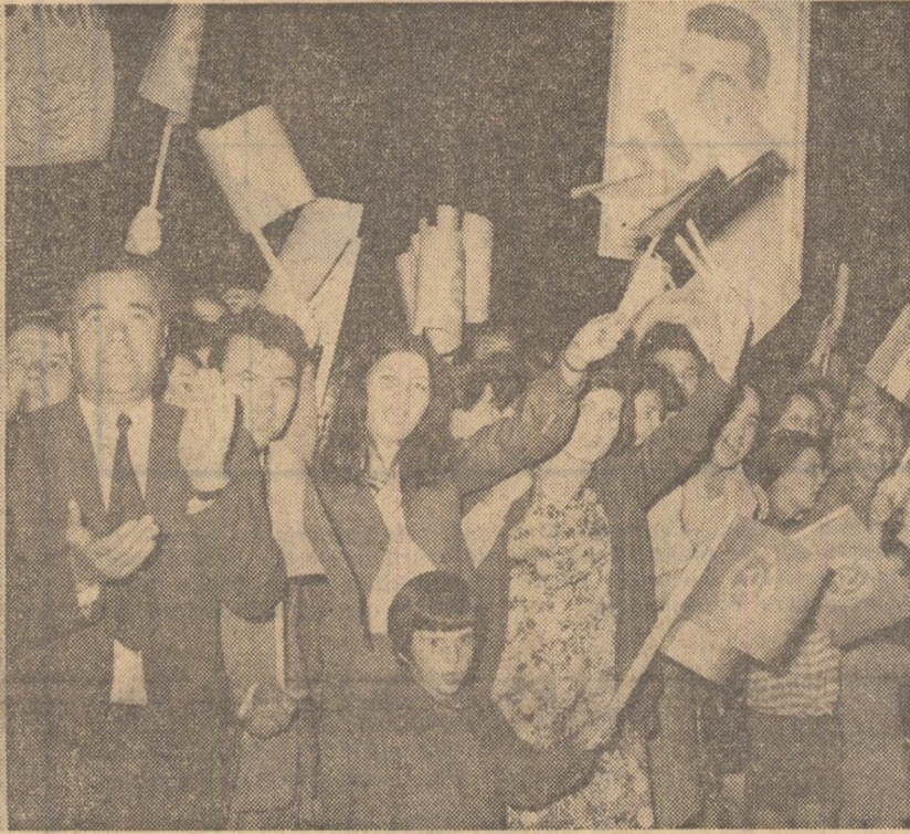
Bucureștii, în numele întregii țări, a făcut ieri o primire caldă, entuziastă, tovarășului Nicolae Ceaușescu și tovarășei Elena Ceaușescu la sosirea pe aeroportul Otopeni