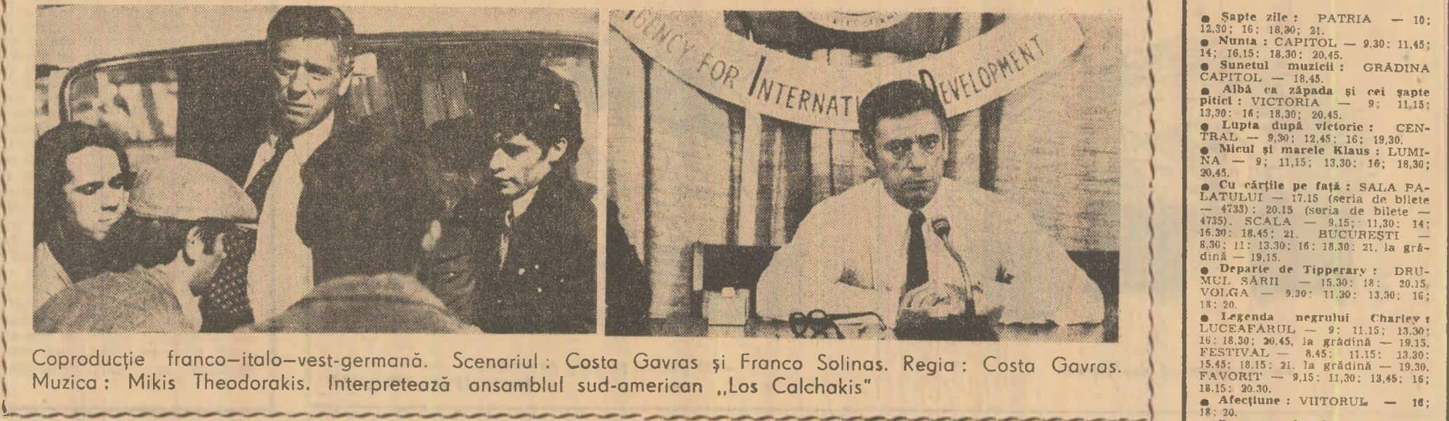
Coproducție franco-italo-vest-germană. Scenariul: Costa Gavras și Franco Solinas. Regia: Costa Gavras. Muzica: Mikis Theodorakis. Interpretază ansamblul sud-american „Los Calchakis”