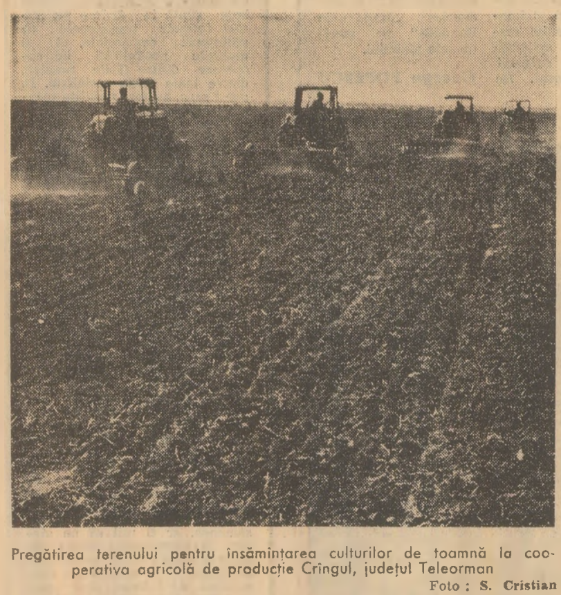
Pregătirea terenului pentru însămînțarea culturilor de toamnă la cooperativa agricolă de producție Crîngul, județul Teleorman

Termenul de punere în funcțiune a celor două importante obiective de la Combinatul de îngrășăminte chimice din Tg. Mureș - instalațiile „Azot V” și fabrica de îngrășăminte complexe NPK - se apropie. În conformitate cu prevederile planului, aceștia noi capacități vor trebui să dea producție la sfîrșitul anului 1973.