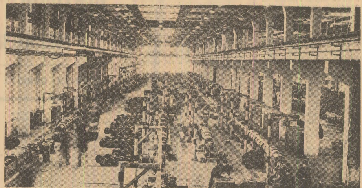
Preocupare la ordinea zilei a colectivului de la întreprinderea „Industria sirmii” din Cimpia Turzii: realizarea exemplară a planului și a angajamentelor asumate în întrecere. În imagine: fabrica de cabluri de tracțiune