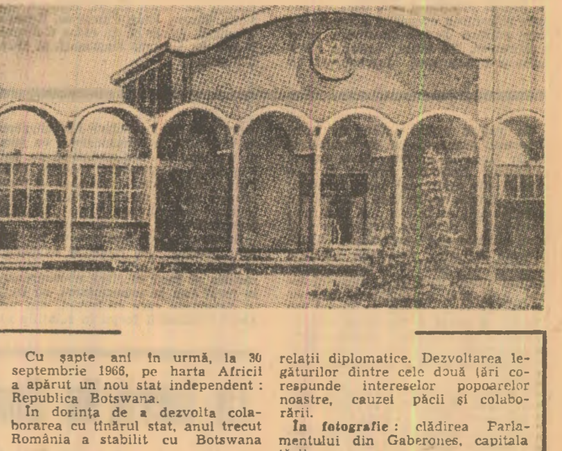
relații diplomatice. Dezvoltarea legăturilor dintre cele două țări corespunde intereselor popoarelor noastre...

NICOLAE CEAUȘESCU Președintele Consiliului de Stat al Republicii Socialiste România