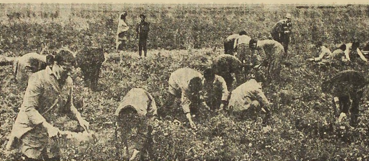
Elevi de la liceul „I. L. Caragiale” din București la culesul legumelor

Graficele privind recoltarea și prelucrarea produselor sînt, în general, respectate în județul Brăila. Au fost asigurate mijloace de transport — 150 autocamioane cu remorci de la autotoboză și alte 100 de camioane ale unor întreprinderi din oraș — ceea ce a sporit mult capacitatea de prelucrare a legumelor. De asemenea, au fost organizate de către I.L.F. două centre mari de prelucrare a tomatelor pentru bulion, la Brăila și Jirila, unde zilnic sînt preparate circa 80 tone pastă de roșii, precum și în cooperativele agricole Ibrănu, Sutești, Movila Mireșii și altele.