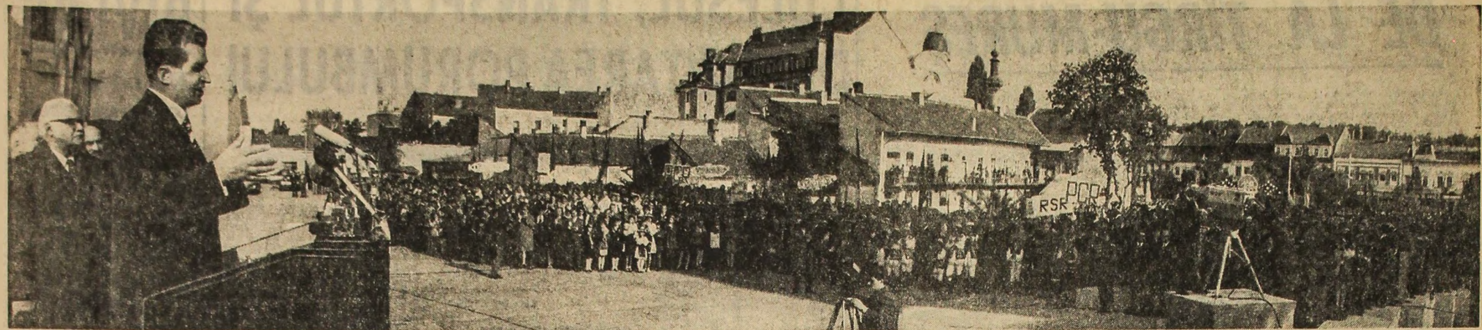
În timpul adunării populare de la Tirgu-Mureș