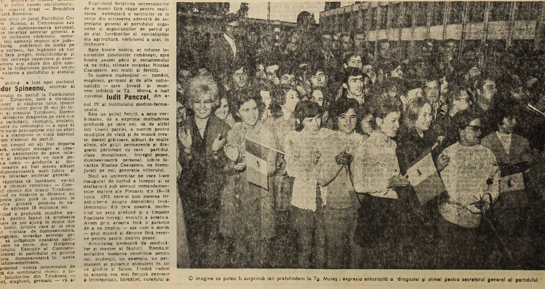
O imagine ce putea fi surprinsă ieri pretutindeni la Tg. Mureş: expresia entuziastă a dragostei şi stimei pentru secretarul general al partidului

Rubrică redacţională de Dumitru TÎRDOB Gheorghe DAVID şi corespondenţii „Scintei”