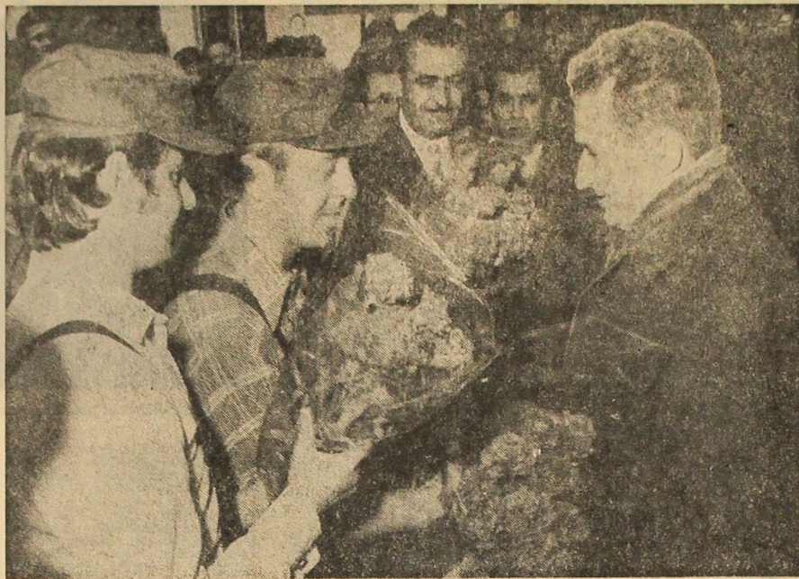
Primire călduroasă la întreprinderea de prelucrare a lemnului „23 August”

Producția de îngrășăminte chimice pentru agricultură, de utilaje pentru industria ușoară, de produse de larg consum, de mașini electromecanice de calculat, inaugurarea elegantului edificiu al teatrului, ca și preocupările urbanistice au prilejuit o largă cuprindere a realizărilor de pînă acum, o analiză rodnică a problemelor, recomandări substanțiale.