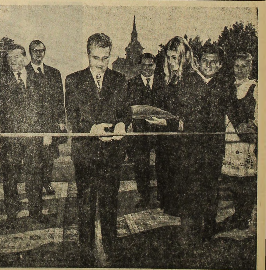
Un moment memorabil al vizitei: tovarășul Nicolae Ceaulescu inaugurează noul teatru