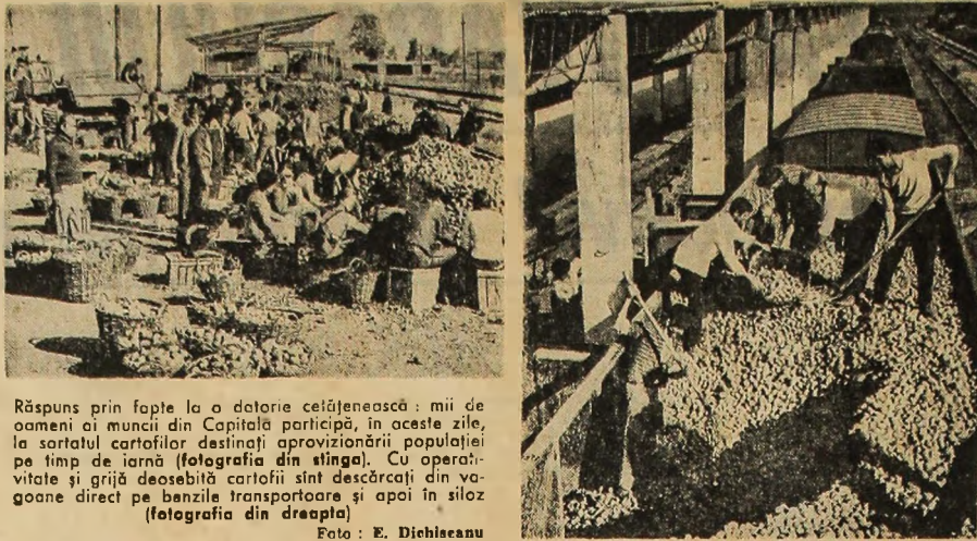
Răspuns prin fapte la o datorie cetățenească: mii de oameni și muncii din Capitală participă, în aceste zile, la sortarea cartofilor destinați aprovizionării populației pe timp de iarnă (fotografia din stânga). Cu operațiunile și grijă deosebită cartofii sunt descărcați din vagoane direct pe benzile transportoare și apoi în silozuri (fotografia din dreapta).