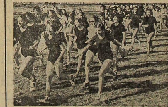
Ieri, la baza sportivă Tei, în timpul întrecerilor de cros prilejuite de deschiderea anului sportiv universitar

Constructorii Uzinei cosco-chimice din Galați au îndeplinit planul anual valoric, succes care, după aprecierea directorului Grupului de saniere, ing. Aurel Manolache, va permite realizarea în 1973 a unor lucrări suplimentare în valoare de peste 35 milioane lei. Sînt avansate lucrările la bateria de cofecționare nr. 3, a cărei hală de înzidire a fost terminată cu 8 luni mai devreme decît prevedea graficele de execuție. Se lucrează intens, în trei schimburi, și la bateriile de cofecționare nr. 5 și nr. 6, unde se toarnă betoane în radier. La secția de prelucrare a gudroanelor au început excavatiile și se pregătesc cofrajele pentru primele turnări de beton.