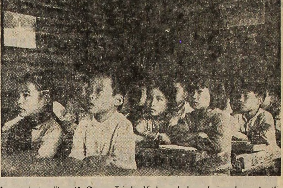
În provincia eliberată Quang Tri din Vietnam de sud și-au început activitatea 86 școli primare și 12 școli medii. În fotografie: O clasă de elevi, în timpul orelor de predare.

Ansamblul de dansuri populare românești „Crăișorul” din Brașov a intrat în timp de aproape o lună de zile un turneu în mai multe orașe din Marea Britanie. Înregistrind un succes deosebit, O confirmă ropotele de aplauze culese în Londra, Oxford, Manchester, Sheffield, Plymouth și Southampton, cronicele de specialitate, care nu s-au aflat să folosească termenii ca „formidabil”, „extraordinar”, ca și transmișile în direct sau înregistrate la radio și televiziune. La St. Albans, primul și singurul consiliul municipal au venit în culise să-l felicite pe artiștii români; la Felixton, numeroși spectatori au urcat pe scenă îmbrășiindu-l pe dansatorul și instrumentistul și mulțumindu-le pentru „splendida seară românească” pe care le-au oferit-o; la Plymouth, artiștii români au fost conduși la autobuze de sute de eștioni, care au făcut să-și lăsaș rîsul de la mesagerii artei românești. Toate aceste manifestări au constituit — după cum subliniază ziarul „Kensington News” — „dovezi ale înaltei aprecieri față de nestematele zestre folclorice a poporului român”. N. PLOPEANU