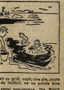
„Marele negre”: Stringeți cu grijă, copii, cine știe, poate că așa, în instalația de încălzire, ne va prinde bine (Desen din ziarul vest-german „Die Welt”)

Zimbetul Giocondei va deveni mai rece? — se întreba un confrate parizian. Nu, desigur. Marile opere de artă se bucură în continuare, în muzeu, de un microclimat special, destinat conservării lor optime.