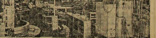
Imagine din secția mecanică a întreprinderii de mașini-unelte și agregate din București

O latură deosebit de importantă a activității cu cadrele o constituie reparatizarea lor judicioasă în raport atât cu calitățile lor personale, cât și cu necesitățile specifice ale fiecărui loc de muncă. Omul potrivit la locul potrivit”, această maximă capătă o pondere și mai mare când „locul” respectiv este un loc cu atribuții de conducere a unor sfere ale vieții sociale. Dar oare s-ar putea susține că în toate orga-