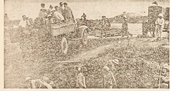
REPUBLICA VIETNAMULUI DE SUD. Eforturi susținute pe șantierele de reconstrucție a unui pod din provincia Quang Binh.

Ca urmare a unei alunecări de teren, cel puțin opt persoane și-au găsit moartea pe o goșoaie din zona de sud-vest a Columbia — s-a anunțat oficial la Bogotă.