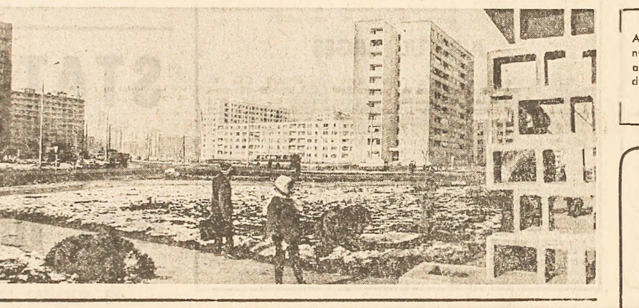
Aspect de sezon din microcraionul nr. 6 — cea mai nouă zonă a cartierului „Drumul Taberei” din Capitală, dată recent în folosință

beneficiarul vitorului edificiu social-cultural dau zor la modificarea interioarelor, în săparea șanțurilor pentru instalarea de apă caldă și canalizare etc. Printre cei mai activi sînt tinerii de pe șantierul de construcții și de la întreprinderea de gospodărie locală. Conduce de către organele locale de partid, acțiunile inițiate sub genericul „Fiecare tînr, un bun gospodar” constituie o formă eficientă de educare a tineretului în spiritul dragostei față de muncă, al ordinii și disciplinei, al grijii față de avutul obște. Pe această linie se înscriu și lucrările patriotice efectuate de către tinerii de la întreprinderea de utilaje și piese de schimb la înălțarea unui cămin ce le-a fost destinat, de către tinerii din cooperativele meșteșugărești, care au adus o contribuție substanțială la construirea unei moderne baze sportive. Dar nu numai în municipiul Suceava tinerii sînt participanți și beneficiarii propriilor acțiuni. Organizațiile U.T.C. din Gura Humorului, bunăoară, răspund chemării comitetului orgănesc de partid, au luat parte activă la construirea complexului sportiv din Lunca Moldovei, în cadrul acțiunii „Fiecare tînr, un bun gospodar”, a mai fost realizat, de asemenea, complexul turistic al tineretului de la Cîmpulung Moldovenesc, o casă de cultură a tineretului la Socola, alte două edificii similare în comunele Putna și Arbore. Gheorghe PARASCAN corespondentul „Științei”