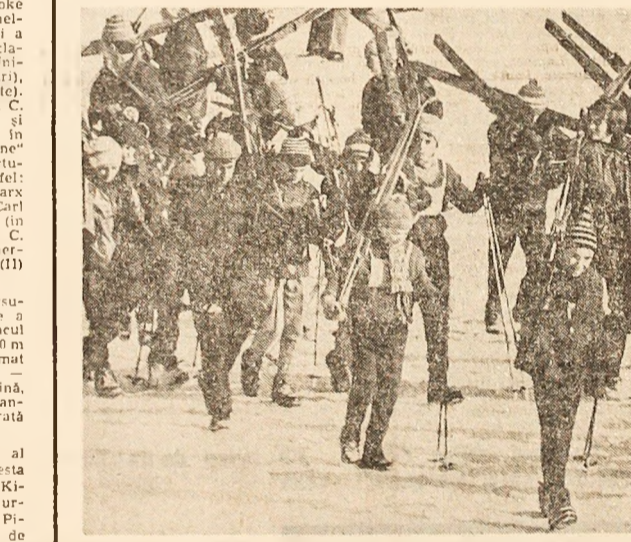
Cimpulung Moldovenesc. — Cu profesorul în mijloc, spre pirtia de schi

Intreținerea a vigozii și... (Text discusses physical education and health for young people.)