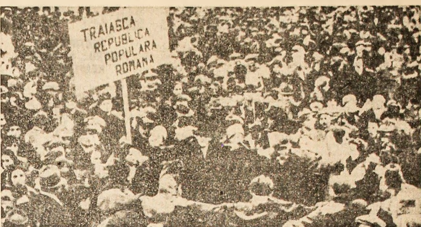
In Piața Palatului poporul sărbătorește proclamarea republicii

„Timpul istoric, fie lung, fie scurt, poate dobîndi profil de epocă datorită realizărilor umane care l-au marcat și-l definițivează... Ințr-un răsărit scurt, dar foarte li-