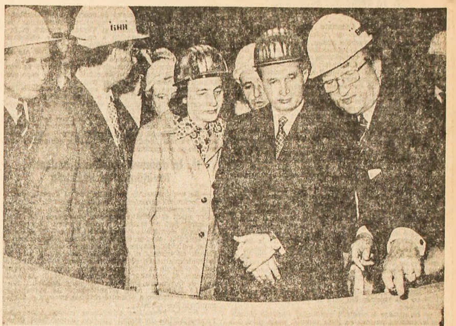
28 iunie, într-o uzină din R. F. Germania