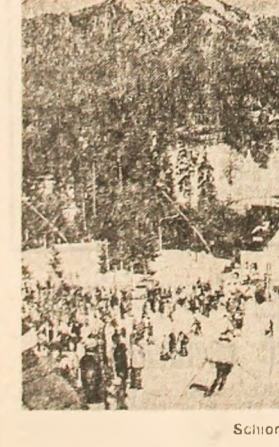
Schiștii la Clăbucet.