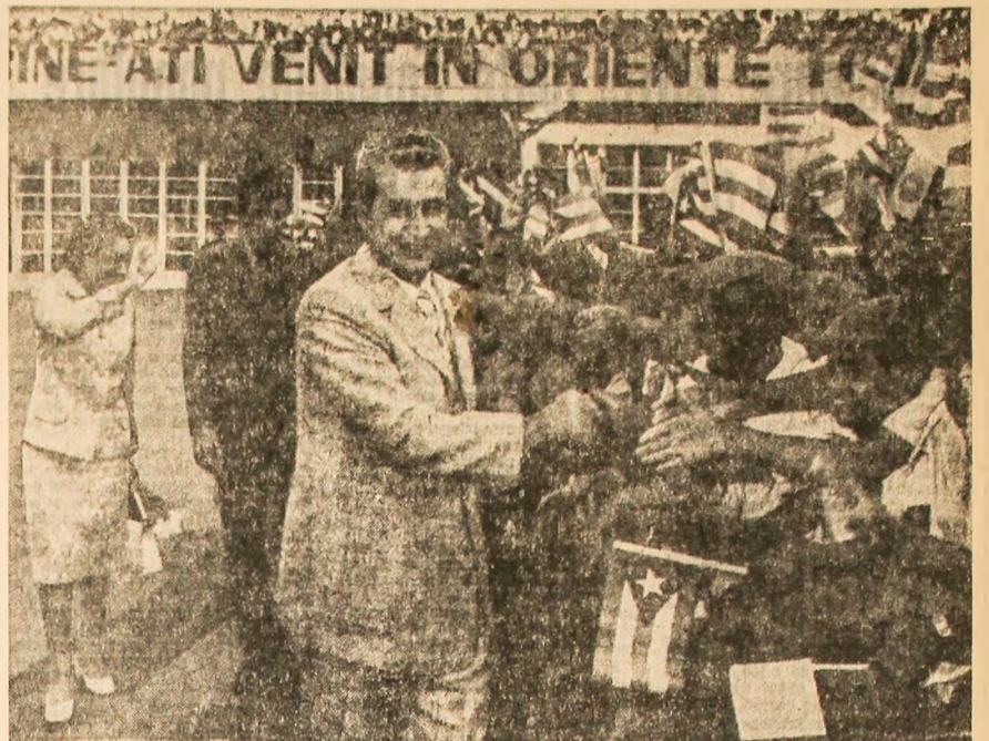
2 septembrie, în Cuba

În cursul anului 1973, reprezentanți ai C.C. al P.C.R. au participat la congrese ale partidelor comuniste și muncitorești din: Danemarca, San Marino, Argentina, Peru, R. F. Germania (P.C. German), Norvegia, Belgia. De asemenea, reprezentanți ai P.C.R. au participat la congrese ale partidelor socialiste din Norvegia, Franța și la congresul partidului A.K.F.M. (Congresul pentru independența Madagascarului).