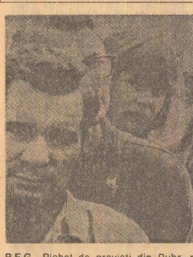
R.F.G. Pichet de greviști din Ruhr, revendicînd condiții mai bune de muncă

ajutoare de milioane de dolari pentru înlocuirea șeptelului decimat și aprovizionarea de urgență cu semințe. Celelalte state africane afectate de flagel sînt, după cum s-a mai amintit, Nigerul, Senegalul, Volta Superioară și Ciadul.