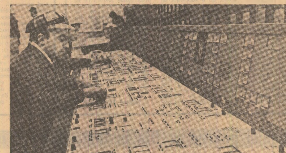
La panoul de comandă al termocentralei de la Rogojelu

mai departe după ce s-a scuțat încă o dată. N-avea de ce. Mașina salvării nu se vedea. A apărut însă de pe o stradă laterală un IMS. A oprit pe partea centrală a străzii. Cu un glas răstîit, vulgare, soferul mi-a strigat: — Pe cine aștepți, țâ? — Nu s-am răspuns. — Nu vrei să spui? De ce nu vrei? — Am făcut. A pornit mînd departe. Am răsuflat ușurat. Dar la scurt timp, brusc, lăsmă mine, a frînat același IMS. Și aceeași voce insolentă, vulgare. — Nu vrei, ha, să spui pe cine aștepți? Numai de bădărnăia lui nu-mi ardea. De cuvintele lui înșușante, brutale. — Hai, spune pe cine aștepți? — Ceasul se apropia de ora două noaptea. Mi s-a făcut frică. La numai câteva sute de metri o femeie continua să trînsască momente de deznaștere, iar aici un om de nimic își îndăria obrăznicii pentru care poate bicitura în public ar fi o pedepsă prea mică. Am avut totuși țîria să-i răspund: — Aștept să picăciți dumneavoastră ca să vă pot nota numărul mașinii. A accelerat, mormăind cuvinte injurioase în timp ce notam grăbit numărul mașinii: 22-B-96... Dar ce importanță mai avea numărul? Din capătul străzii venea salvarea. Am uitat pe loc incidentul penibil. Acum, cînd la vecini e liniște, cînd pericolul a trecut, nu pot să nu-mi amintesc acea oră din noaptea, cu mîrșălele și întîmplările, care spun și bune și rele despre oameni. „Și, care, aș adăuga, trebuie să ne îndemne nu numai la mîrșăle, ci și la atitudine. Nicolae DRAGOȘ