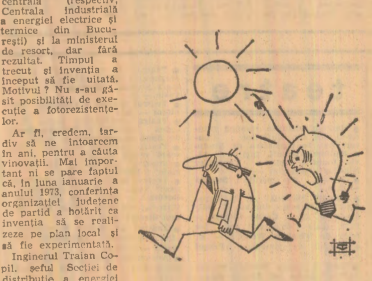
Desen de V. TIMOC