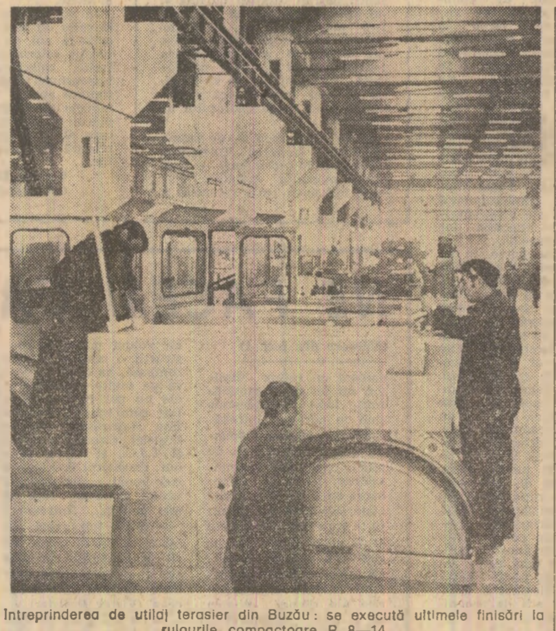
Întreprinderea de utilități terasier din Buzău: se execută ultimele finisări la rulourile compactoare R 8-14.

Pentru lecții. Aritmetică, geografie, istorie... Tot ce se învîdă în ziua respectivă la școală. La un moment dat învîdătoarea, încheindu-și lecțiile, a venit să-și ia rămas bun. — Poate, totuși, serviiți o cafea, o imbăia gazda. — Cu plăcere, dar... altdată. Acum mă grabesc să ajung la Șerbanescoștii noi la Hogan. După plecarea învîdătoarei, prietenul meu mi-a vorbit cu ușoară emoție: — Un dascăl minunat. Un om care meriță tot respectul. A doua zi am avut prilejul să discut despre Maria Molodet, învîdătoare la școala generală nr. 5 din Sibiu, de aproape 40 de ani în această nobilă muncă, cu inspectorul general al Inspectoratului școlar județean, „O cunoașc, o știu și eu. Este într-adevăr o învîdătoare cu „mîna fierbîntă”. Am fînt și sa consemnez gîndul simplu, de prețuire, pentru acest dascăl cu inima fierbîntă și cu sufletul de aur... Nicolae BRUJAN