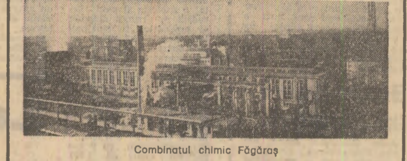
Combinatul chimic Făgăraș

buloane (de vreo... 200 de bucăți), 20 țevi de doi toli, mai multe bidone, cărămizi, nisip, pietriș, fier-beton... — Și rogojinile de ce le lăsați? — strigă după noi un locatar cînd să dăm colțul la plecare. Constructorul le-a părăsit de mult. — După ce facem cîteva transporturi din micro 33, ne abatem și pe la micro 19. Pentru a ne completa stocul: cîteva sute de cărămizi (numai calitatea I), mai multe plăci de beton (un fel de pereți gata turnați), din nou fier-beton, nisip, pietriș și chin... o barcă (că de ne aflăm doar la cîteva pași de Dunăre). — Ajunși în acest punct al documentării, ne-am retras să facem socoteliile: ne țeso sau nu casa? În mare, cele adunate ne erau suficiente. Totuși, mai lipseau cîteva lucruri. Așa că am pornit din nou la drum. Ce materiale am mai găsit? În strada Primăverii — mai multe grămezi de nisip, două vârnite pentru preparat mortar, un butoi metalic. În strada 1 Mai nr. 22 — coturi și țevi de fontă, cofra-