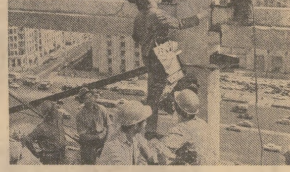
Pe un șantier de construcții din Moscova

Sistemul circulator al orașului crește necontenit. În croaziera noastră ne încercăm drumul cu numeroase ra-