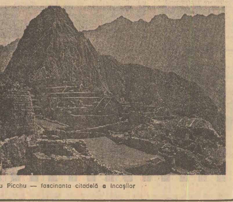
Machu Picchu — fascinantă cetate de Incașilor