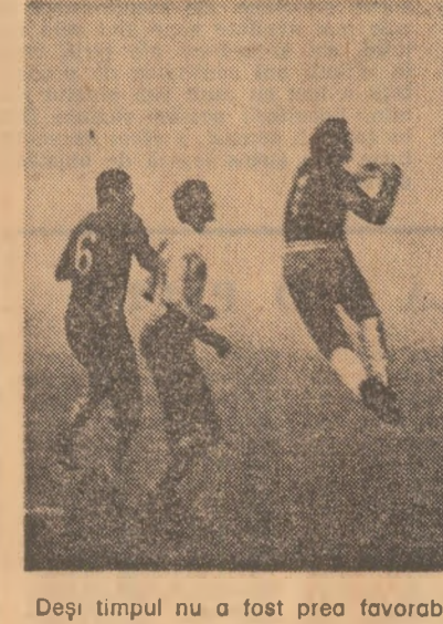
Deși timpul nu a fost prea favorabil, fotbalistii de la Rapid și Dinamo au luat în seriozitate jocul lor amical de ieri, de pe stadionul Giulești. Efectul? Șase goluri - cite trei în fiecare poartă. În sala Florescu, un meci atractiv: I.E.F.S. - Universitatea Cluj

La Polana Brasov a luat sfârșit competiția internațională de biatlon „Cupa Poiana“, la care au participat schiori din Bulgaria, Cehoslovacia, R.D. Germană și România.