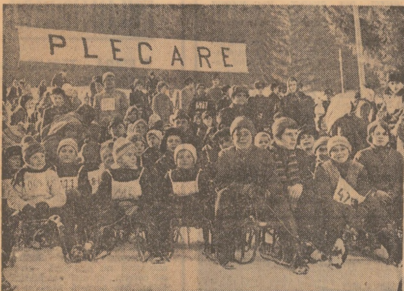
Săniuș - sport de bază în ediția de iarnă a „Cupa tineretului“ - a fost preferată în întrecerile din acest sezon de un mare număr de concurenți și concurente. Imaginea de mai sus reprezintă un start pe pirtile de la Cimpulung Moldovenesc

NOI INTRECERI IN CADRUL ETAPEI DE MASĂ A MARI COMPETIȚII • PE PIRTILE DE SCHI ȘI SĂNIUȘ DIN BUCEGI, PARING ȘI MARAMUREȘ • IN LIPSA ZĂPEZII - CONCURSURI DE ȘAH, TENIS DE MASĂ, POPICE • DUMINICĂ CULTURAL-SPORTIVĂ LA MONEASA