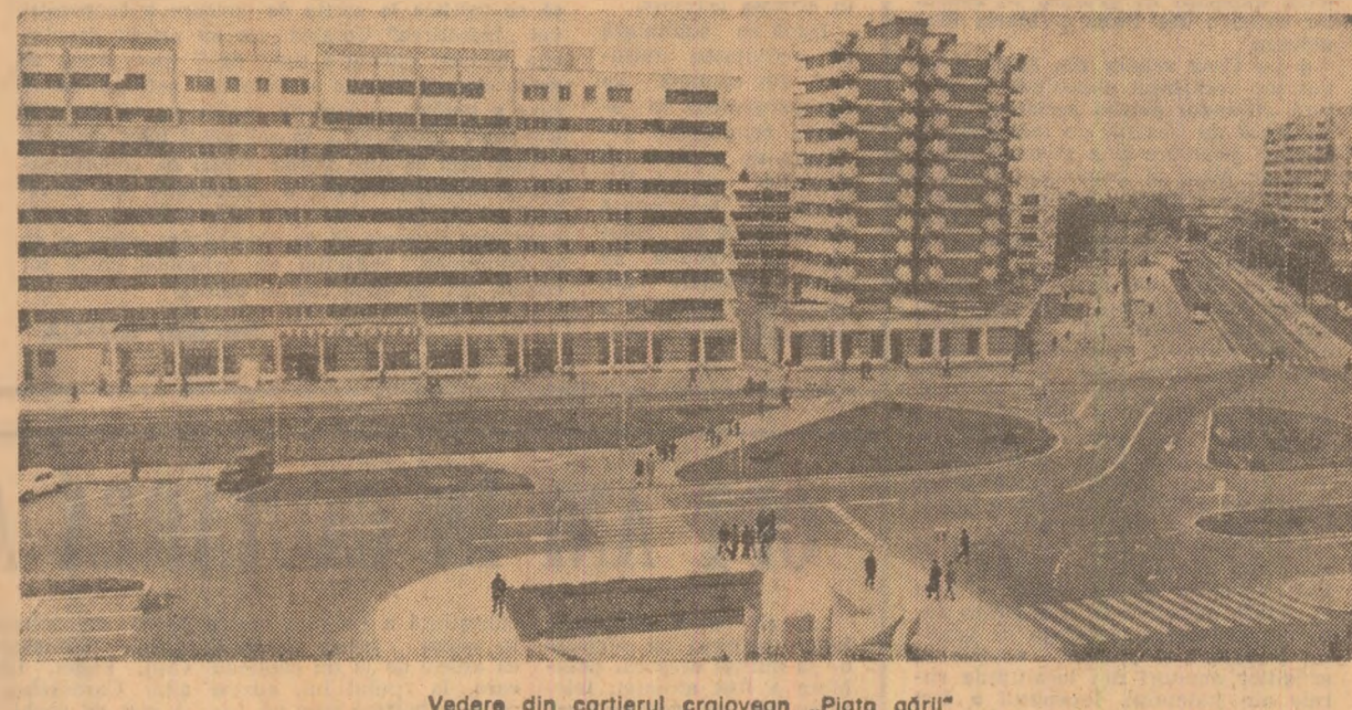
Vedere din cartierul craiovean „Plaza gării”