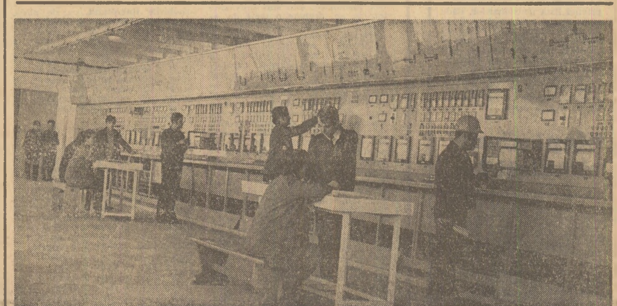
După cum se arată în comunicatul dat publicității ieri, în anul 1973 au intrat în exploatare o serie de noi capacități de producție în industria chimică. Între acestea se numără și noul obiectiv pus în funcțiune pe platforma chimică Săvinești. În fotografie: tabloul de comandă al secției „Poliamid IV”

la București, Edward Wilton Blyden, la cererea acestuia. Cu acest prilej a avut loc o convorbire care s-a desfășurat într-o atmosferă cordială.