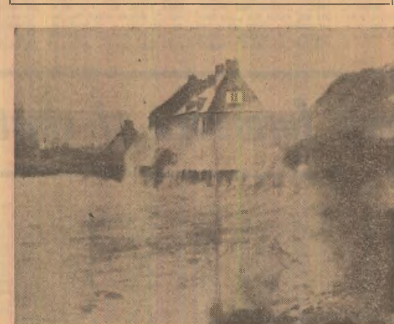
Furtunile puternice care s-au abătut în ultimele zile asupra teritoriului Franței au provocat moartea a patru persoane și importante pagube materiale. În fotografie: valuri deșumflate pe coasta franceză a Canalului Mincel, unde vîntul a atîns viteza de 185 kilometri pe oră

În cursul primei nopți petrecute la bordul navei, medicii au rămas de veghe în camerele astronauților pentru eventualitatea că aceștia s-ar trezi dezorientați. Readaptarea la condițiile terestre, după 84 de zile petrecute în spațiu, necesită un anumit timp, element fiind faptul că, la un moment dat, Carr a lăsat să-i scape din mînă o sticlă, considerînd că ea va pluti, așa cum se petrecuă lucrurile în interiorul laboratorului orbital. Starea generală a echipajului este mai bună decît cea a membrilor echipajelor precedente din cadrul programului, în ciuda faptului că se află în spațiu a acestora a durat mult mai puțin (28 și, respectiv, 59 de zile. Explicația — cele 90 de minute consacrate zilnic exercițiilor fizice.