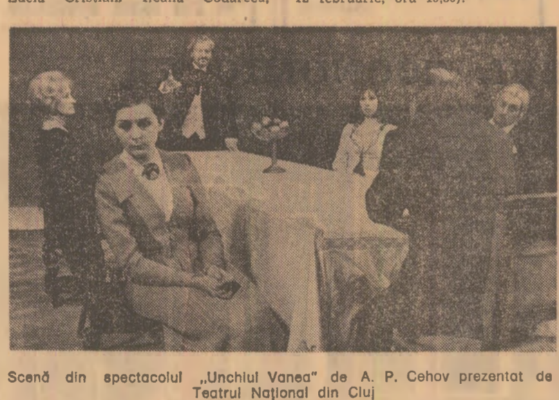
Scenă din spectacolul „Unchiul Vanea” de A. P. Cehov prezentat de Teatrul Național din Cluj