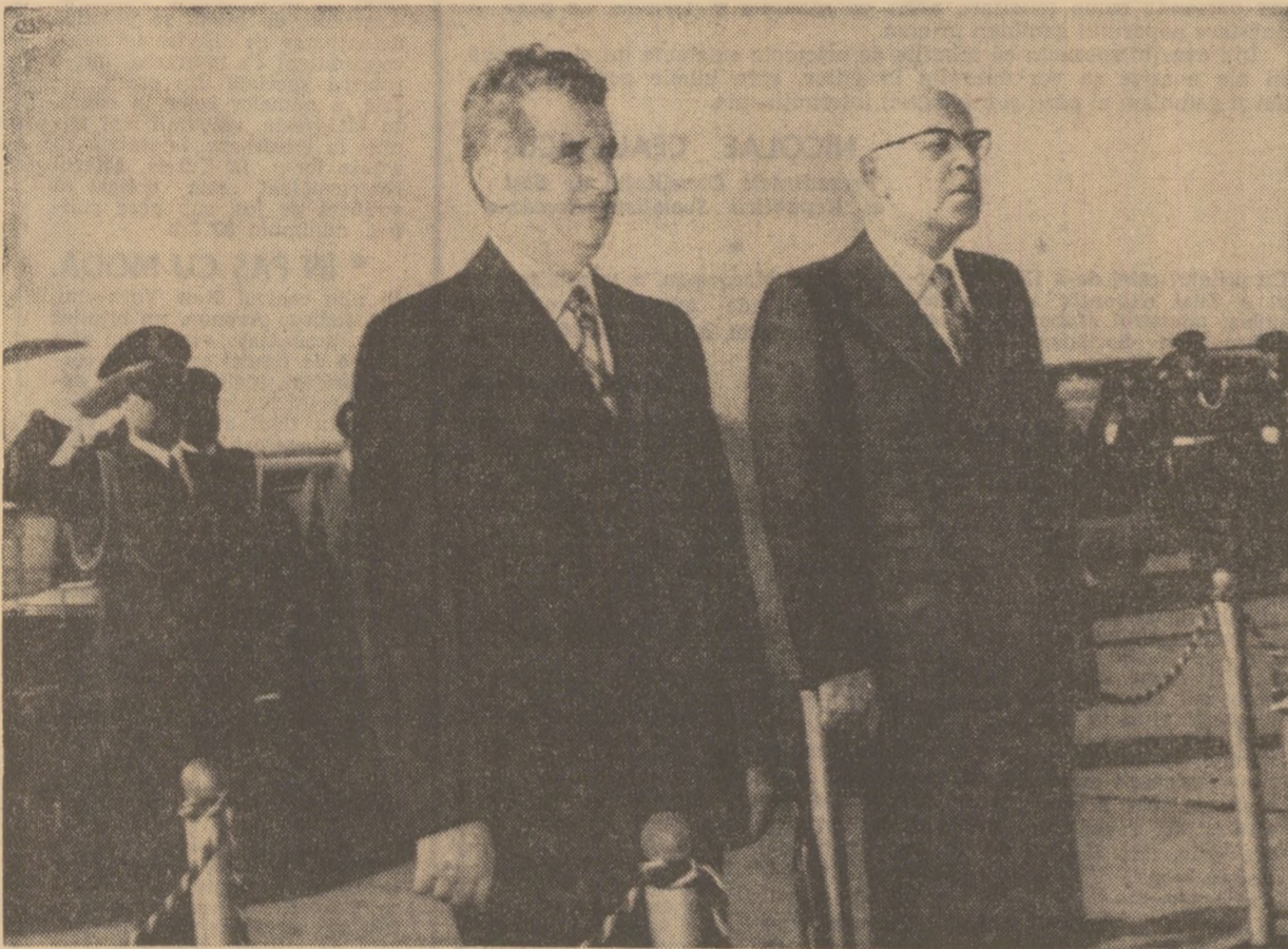
La plecare, pe aeroportul Internațional din Beirut