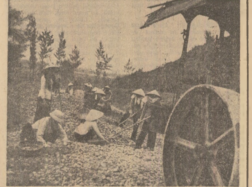
În cadrul lucrărilor de reconstrucție din R. D. Vietnam sînt depuse eforturi susținute pentru refacerea căilor ferate

Analizînd aceste elemente și faptul că organizația „EOKA-2“ a acceptat doar un „armistitiu“ de o lună de zile, guvernul cipriot a apreciat că „situația internă se menține fluidă“, afirmîndu-și hotărîrea de a lua toate măsurile pentru menținerea ordinii.