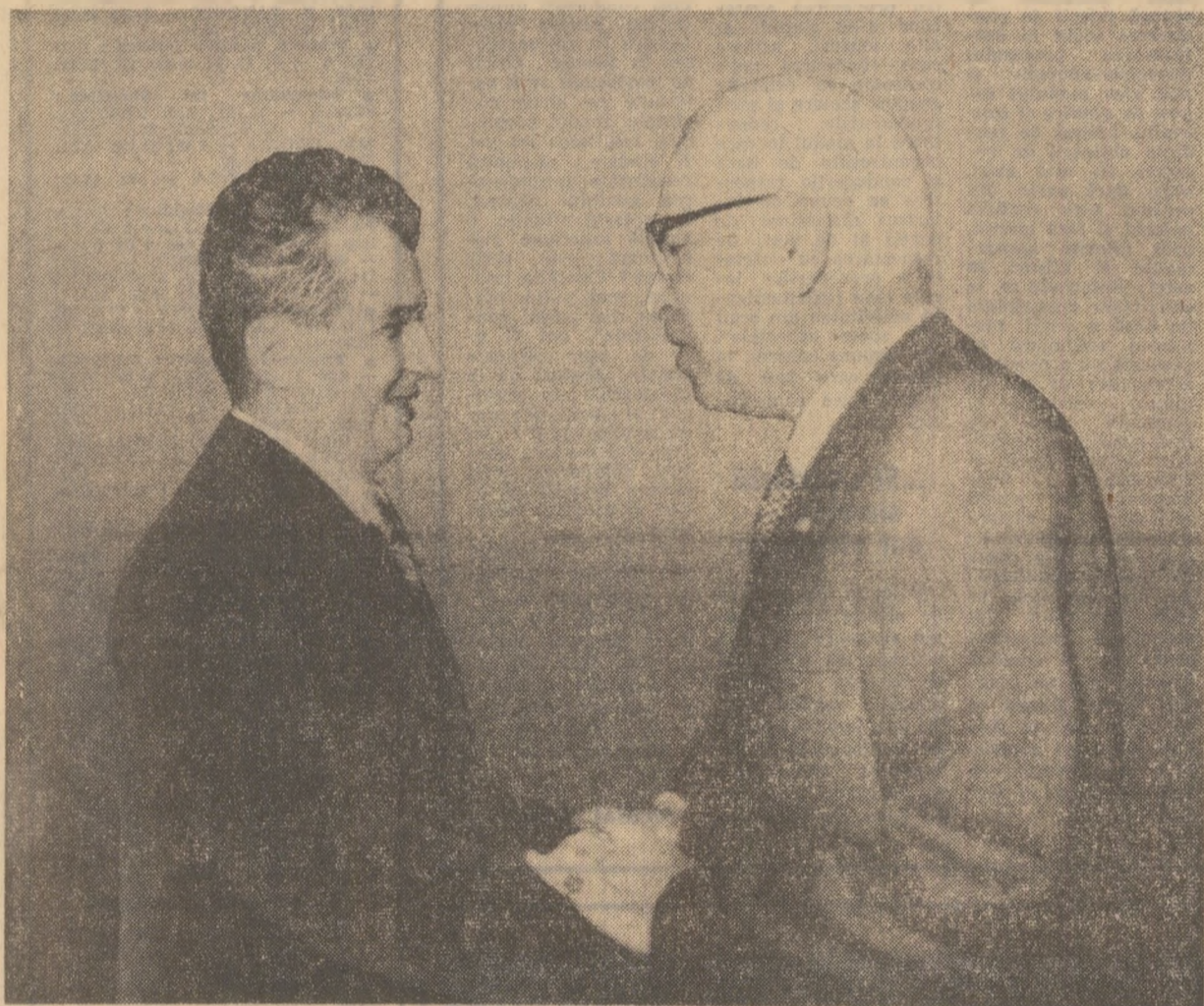
Cei doi președinți își string cu căldură mîinile

■ Satisfacție pentru deplina înțelegere manifestată în convorbiri ■ Perspective rodnice adîncirii relațiilor de colaborare prietenească româno-libaneze, conlucrării internaționale pentru promovarea destinderii și consolidarea păcii