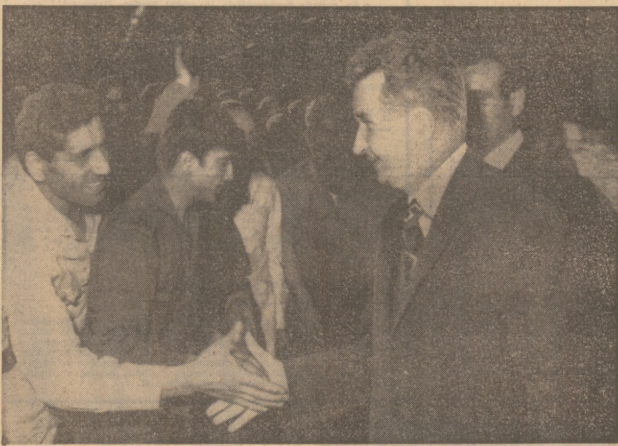
O caldă, muncitorească strângere de mînd