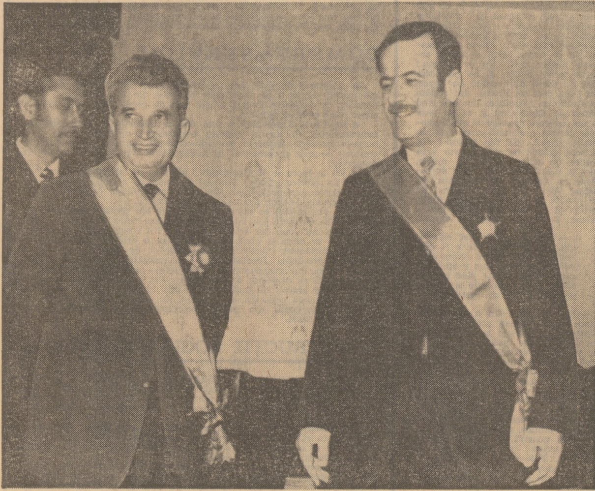
La solemnitatea înmînării unor înalte distincții române și siriene