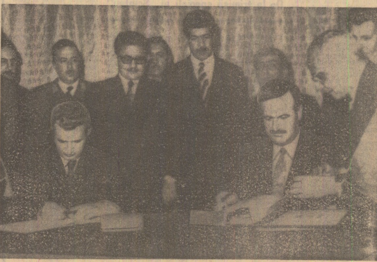
În timpul semnării Comunicatului comun

Dineul s-a desfășurat într-o atmosferă de căldură cordialitate.