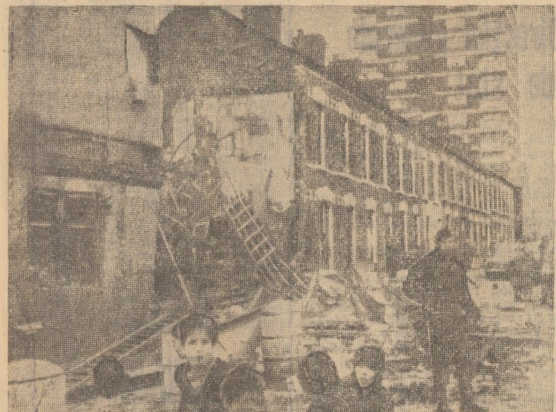
În Irlanda de Nord se înregistrează o nouă serie de atentate teroriste. Ieri, explozia unei bombe plasate într-un automobil a provocat gravă ovarișă a șefului al partidului alianței component al cotului coaliției tripartite a Consiliului executiv (guvernul local). În noaptea precedată a avut loc un atac cu arme asupra locuinței lui Austin Currie, ministru în cadrul consiliului. În fotografie: o clădire din Belfast avariată, zilele acestea, ca urmare a unui act terorist