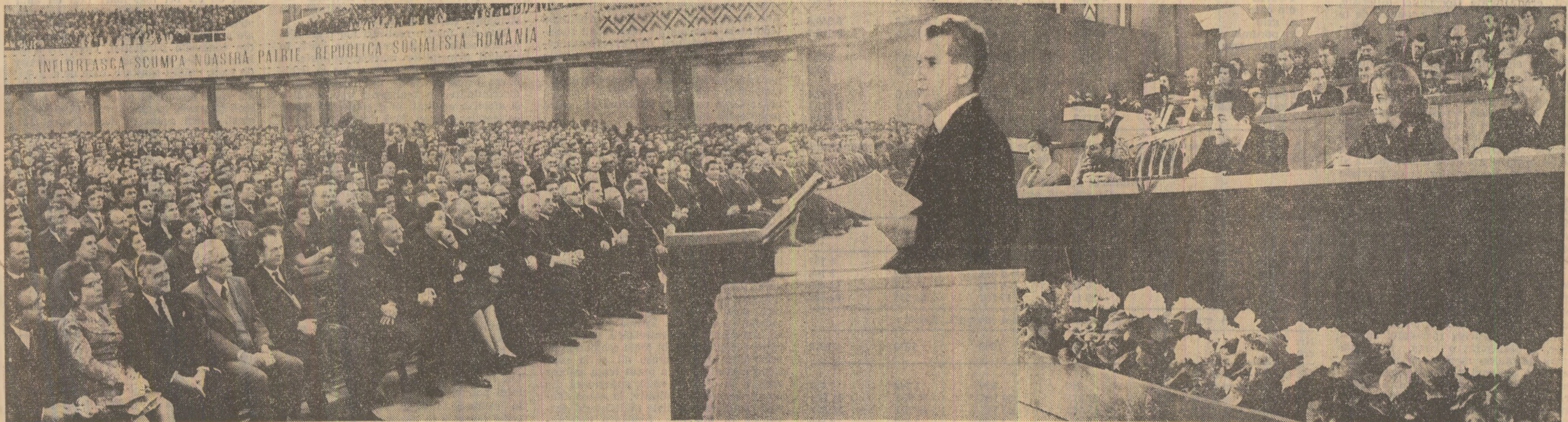
Cuvîntarea tovarășului Nicolae Ceaușescu este urmărită cu viu interes de participanți