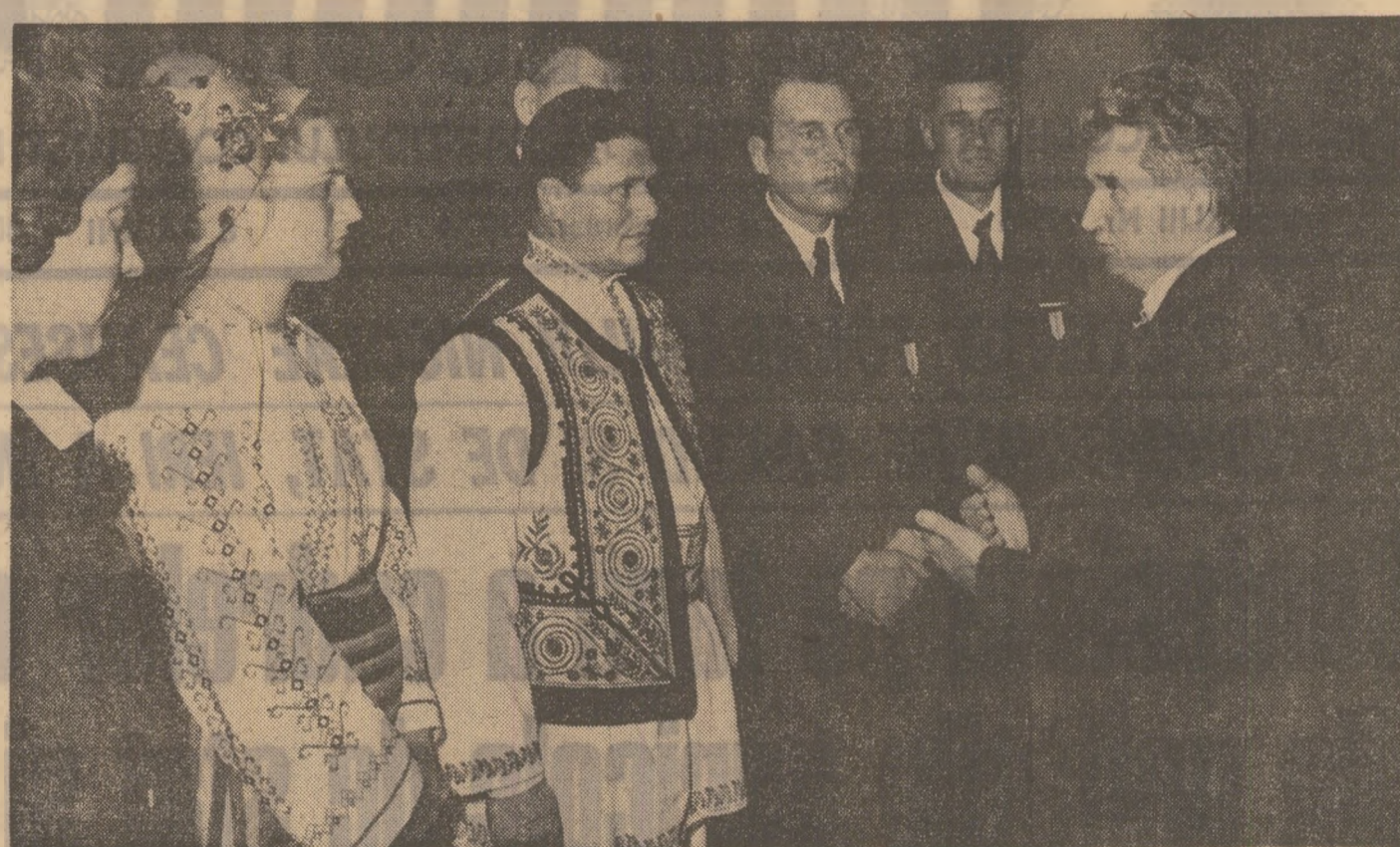
Dialog rodnic cu secretarul general al partidului

După cum se vede din aceste date, atît în sectorul vegetal cît și în cel animal s-au obținut în acești ani creșteri importante, care ilustrează în mod cel mai concret marile avantaje ale agriculturii socialiste, posibilitățile ei de a asigura o producție intensivă. Aceste succese sînt rezultatul politicii partidului de organizare socialistă și de dezvoltare a bazei tehnico-materiale a agriculturii, precum și al muncii hotărîte a țărănimii, a tuturor oamenilor muncii de la sate. Pe această bază au crescut an de an veniturile țărănimii, s-a îmbunătățit aprovizionarea populației cu produse agroalimentare, au fost satisfăcute într-o măsură tot mai largă nevoile generale ale economiei naționale.