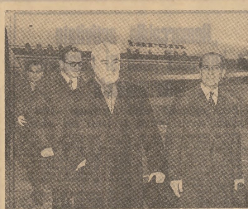
La sosire, pe aeroportul din Budapesta