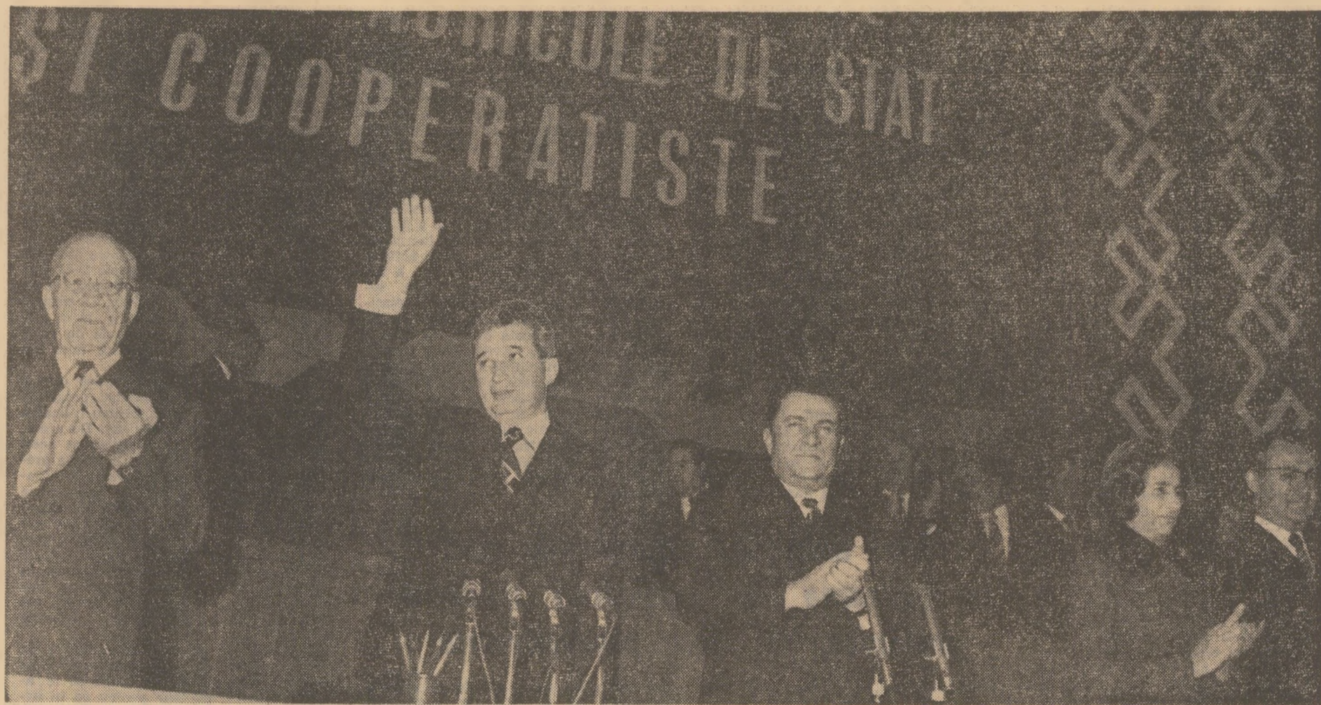
Secretarul general al partidului, alți conducători ai partidului și statului răspund salutului călduros al participanților