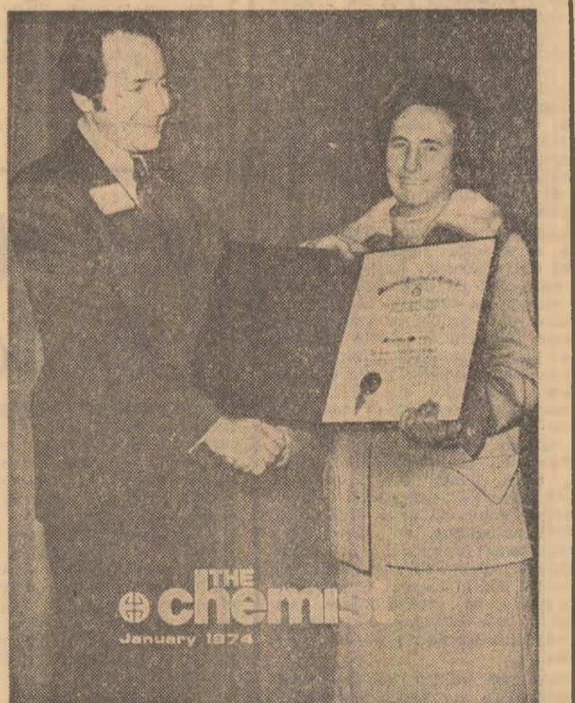
publicată sub titlul : „Laureata indevinută a cooperării” și este însoțită de o notă redacțională în care se arată : „Vă prezentăm traducerea cuvîntului de acceptare al dr. Elena Ceaușescu, rostit la dejunul oferit în onoarea sa de Institutul American al Chimicilor. Este semnificativ că doamna Ceaușescu s-a pronunțat cu fermitate în favoarea colaborării dintre chimiștii și oamenii de știință din toate țările. Acest punct al discursului a fost întîmpinat cu aplauze îndelungate, e logiind faptul că oratorul recunoaște cerințe ale întregii lumi”.

În paginile următoare, revista publică o notă biografică a tovarășei Elena Ceaușescu și textul integral al cuvîntului ce l-a rostit la ceremonia înmînării diplomei. Cuvîntarea tovarășei Elena Ceaușescu este