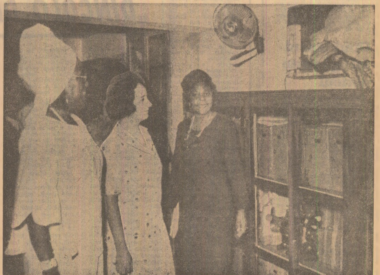
Tovarășa Elena Ceaușescu în vizită la Universitatea din Monrovia