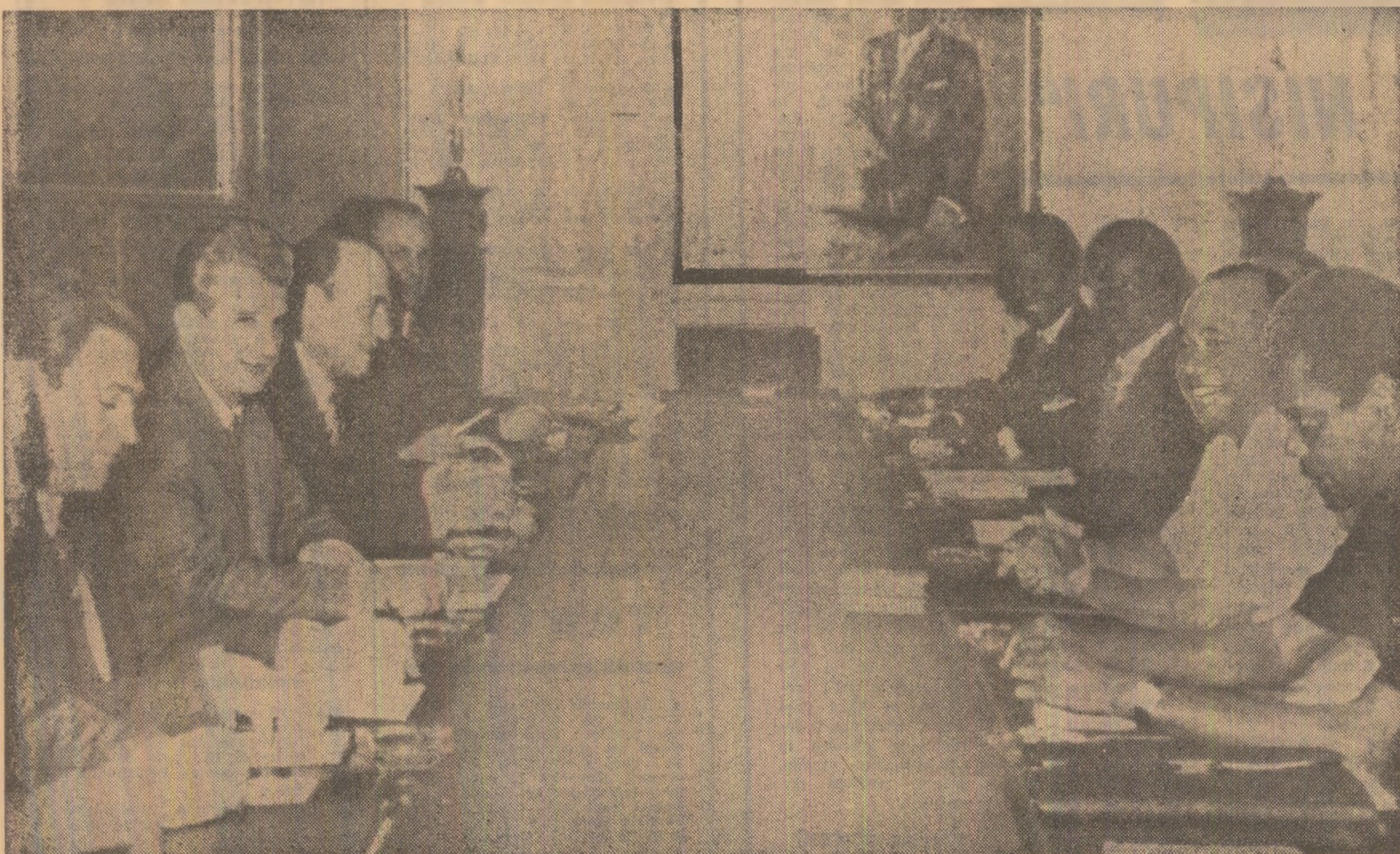
În timpul convorbirilor oficiale

La încheierea vizitei, rectorul, alți membri ai conducerii universității îl mulțumesc, încă o dată, pentru onoarea deosebită ce le-a fost făcută prin această vizită.