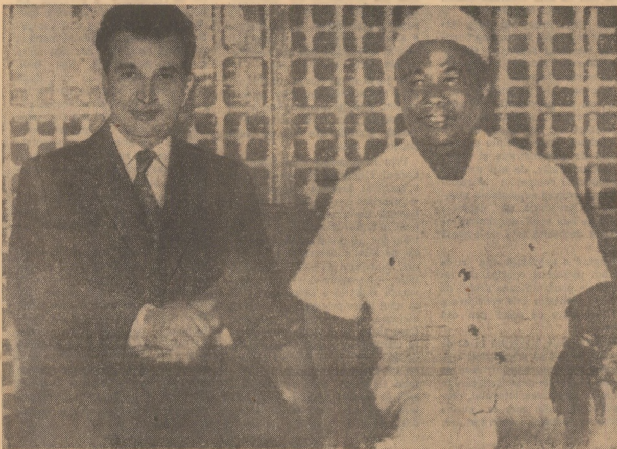
Cel doi șefi de stat, pe aeroportul Internațional Robertsfield

În cursul dimineții de luni, 4 martie, au avut loc convorbiri oficiale între președintele Consiliului de Stat al Republicii Socialiste România, tovarășul Nicolae Ceaușescu, și președintele Republicii Liberia, William Tolbert-jr.