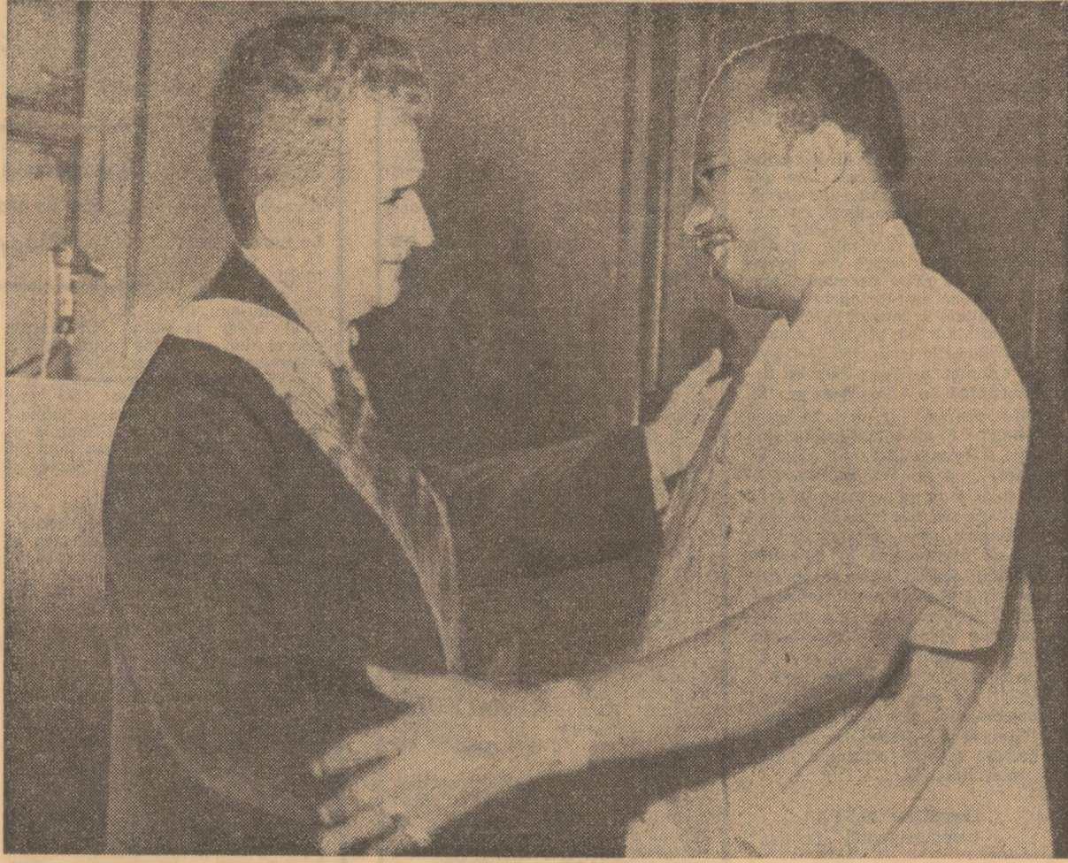
Cei doi președinți se felicită călduros

LA REȘEDINȚA PREZIDENTIALĂ „EXECUTIVE MANSION“