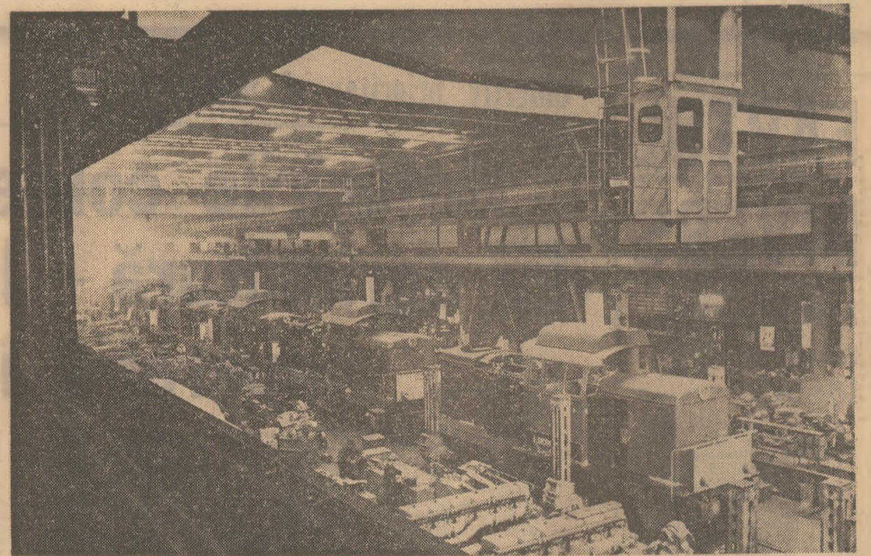
Hala de montaj a locomotivelor Diesel de la întreprinderea „23 August” din Capitală