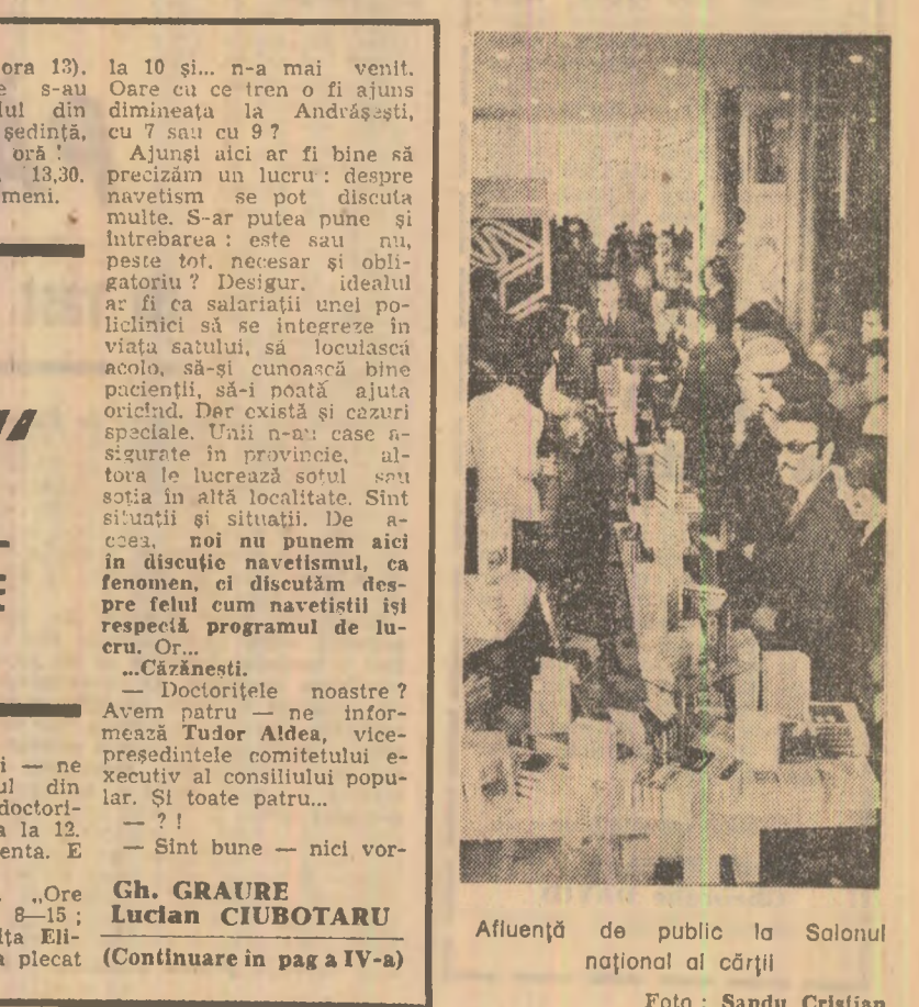
Afluență de public la Salonul național al cărții.