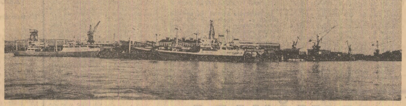
Zi de martie la Dunăre. În fotografie: Șantierul naval din Drobeta Tr. Severin