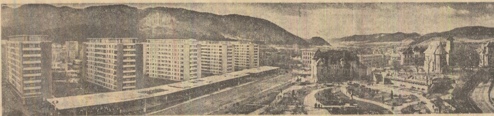
Prezent și trecut în arhitectura orașului Piatra Neamț