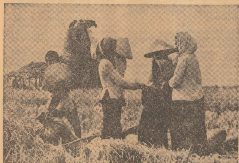
Republica Vietnamului de Sud. Locuitorii ai zonei eliberate din delta Mekongului lucrează la strângerea recoltei de orez.