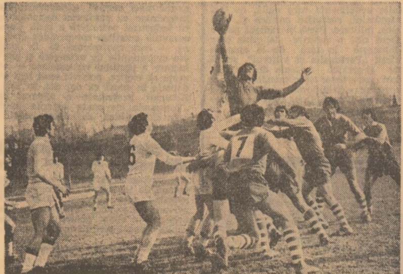
O surpriză (la Năvodari) și rezultate normale în etapa a XI-a a campionatului de rugbi: Steaua - Dinamo 24-7, Sportul studentesc - Farul 3-15, Grivița roșie - Știința Petroșani 16-6, Gloria - Politehnica Iași 14-10, Chimia Năvodari - Universitatea Timișoara 14-0, Rușmentul Birlo - Vulcan 11-7, Agronomia Cluj - C.S.M. Sibiu 3-3. În fotografie: luptă egală, pentru balon, la o tușă în meciul Sportul studentesc - Farul.

„Cupa Europei” pe echipe și tradiționalul concurs internațional individual dotat cu „Trofeul Martini” care au transformat din nou Torino în „capitală” a floretelor feminine mondiale au intrat în desfășurare unanime ale specialiștilor, cit și ale presei sportive italiene.