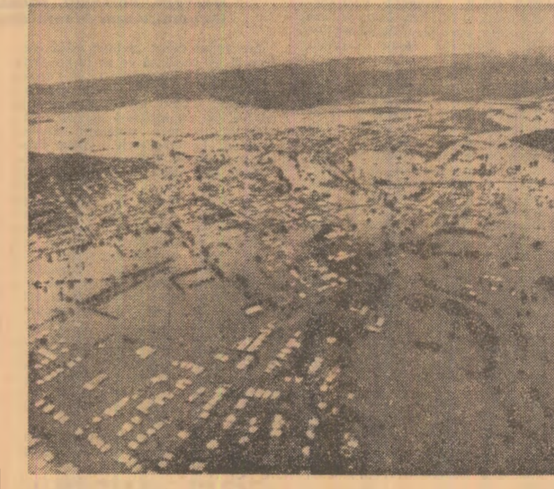
Pirole torențiale cîzute în ultima săptămîină în unele regiuni ale Australiei au provocat mari inundații. În fotografie: localitatea Lismore, din statul New South Wales, cel mai lovit de actualele inundații.

MOSCOVA 17 (Agerpres). — Comentînd primele rezultate obținute de stația automată interplanetară sovietică „Marte-6”, ziarul „Izvestia” relevă că, la 12 martie, capula de aterizare a stației a coborît, timp de 148 de secunde, cu paravasa spre suprafața planetei, transmînd o serie de date științifice care au fost recepționate de stația-mamă și retransmise apoi pe Pământ. Cu acest prilej, oamenii de știință au obținut date importante, printre care și fotografii pe care se disting clar albiile unor fluvii secate. S-ar părea că aceste date sînt de domeniul fantasticului, deoarece, avînd în vedere presiunea atmosferică scăzută de pe Marte, apa ar trebui să fiarbă aici la o temperatură apropiată de zero grade Celsius și de aceea n-ar fi putut exista pe planetă — scrie ziarul. Totuși, pe baza unor cercetări recente efectuate de oamenii de știință americani și a unor calcule realizate cu mașini electronice, s-a emis ipoteza că pe Marte pot exista două stări ale atmosferei, cea cunoscută, și o alta cu presiune de aproximativ 0,1 atmosferă terestră, cu o umiditate mult mai mare și cu temperatură mai ridicată — se arată în articol. Marte prezintă omenilor o surpriză după alta. Primele fotografii, luate de stațiile sovietice și ameri-