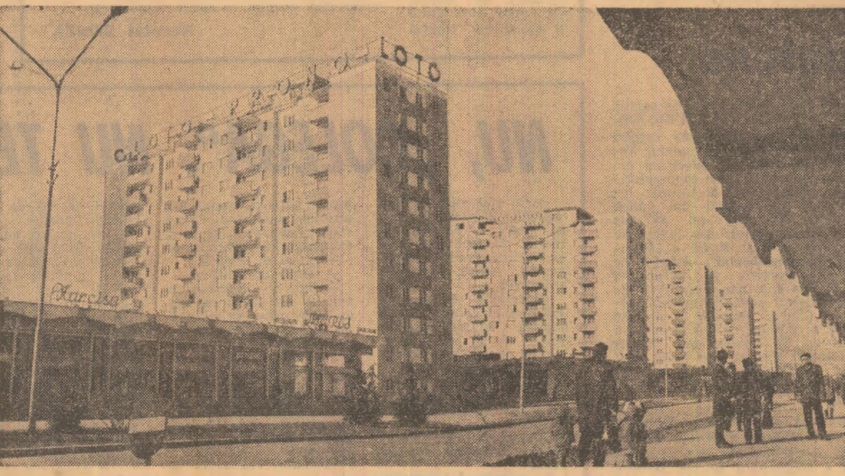
Instantaneu într-unul din noile cartiere de locuințe din Alba Iulia

Ridicând la cote superioare nivelul realizărilor obținute în întrecerea pentru îndeplinirea cincinalului înainte de termen, minerii din bazinul carbonifer al Văii Jiului au furnizat unităților beneficiare din țară mai bine de 40.000 tone de cărbune peste sarcinile de plan ale perioadei 1 ianuarie-15 martie. Prin aplicarea noului program de lucru în subteran, stabilit în ultimul trimestru al anului trecut, prin folosirea rațională a utilajelor și instalațiilor de susținere extracției, încălzire și transport s-a asigurat îndeplinirea și depășirea ritmică a sarcinilor de plan în fiecare decadă.