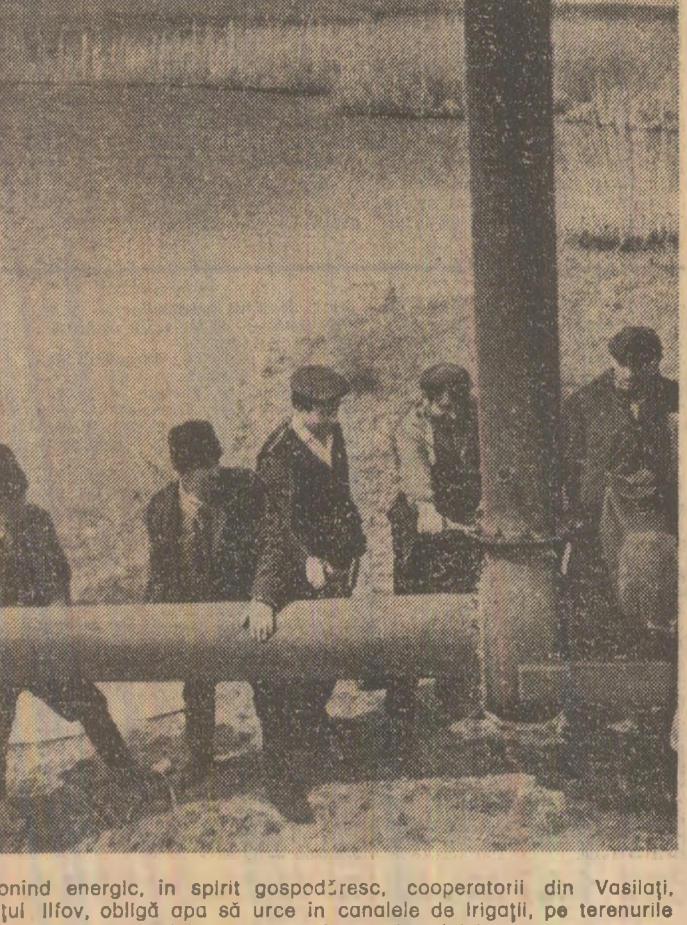
Acționînd energic, în spirit gospodăresc, cooperatorii din Vaslui, județul Ilfov, obligă apa să urce în canalele de irigații, pe terenurile arabile, pentru a le spori rodnicia.

Irigarea culturilor este o metodă sigură de sporire a recoltelor la hectar. Mai ales în condițiile acestor primăveri cu precipitații puține, se impun atît extinderea suprafețelor amenajate pentru irigații, cît și efectuarea mai devreme și cu responsabilitate maximă a udărilor. La sfîrșitul anului 1973, agricultura țării noastre dispunea de o suprafață de 1.250.000 hectare amenajate pentru irigații, care va fi completată în această perioadă cu încă 110.000 hectare, înscrisă în această primăvară, vor putea fi irigate 1.360.000 hectare. Important este că, în timpul cel mai scurt, toate sistemele să fie puse în stare de funcționare, pentru a se putea trece de urgență la efectuarea pe scară largă a udărilor — sarcină de cea mai mare răspundere a organelor de specialitate, a unităților agricole socialiste.