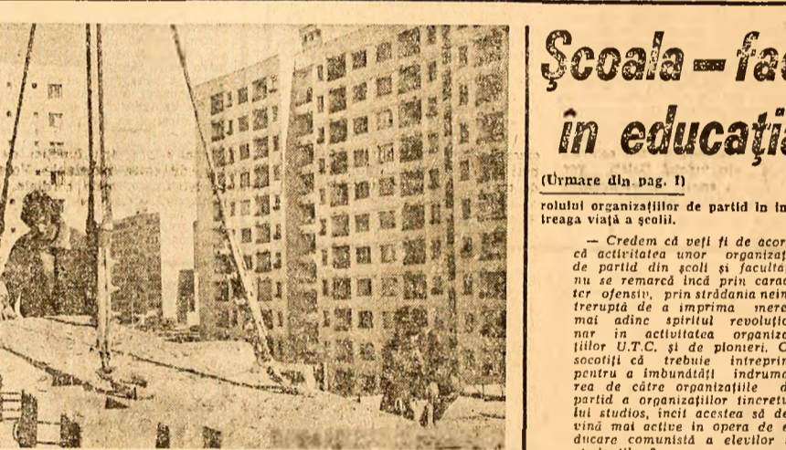
In Drumul Taberei — noi construcții de locuințe în microraionul 6